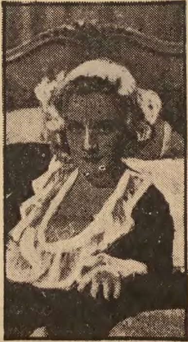
Jedną z wcześniejszych ról Marleny Dietrich.

W Passadenie Marlena Dietrich i autor opuścili pociąg, aby udać się stąd bezpośrednio do Hollywood drogą, o której istnieniu wiedzieli tylko aktorzy filmowi.