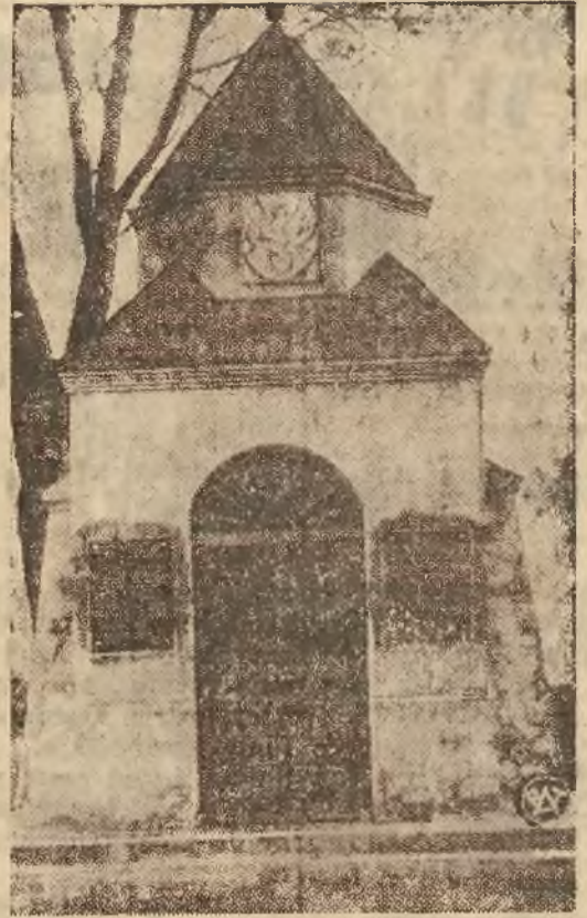
Na zdjęciu — Kaplica — pomnik w Bednarach koło Łowicza, ku czci poległych w 1914 roku Legionistów I-ej Brygady. Uroczyste odsłonięcie tego pomnika bohaterstwa Legionów Polskich odbędzie się w dniu 30-go października b. r.