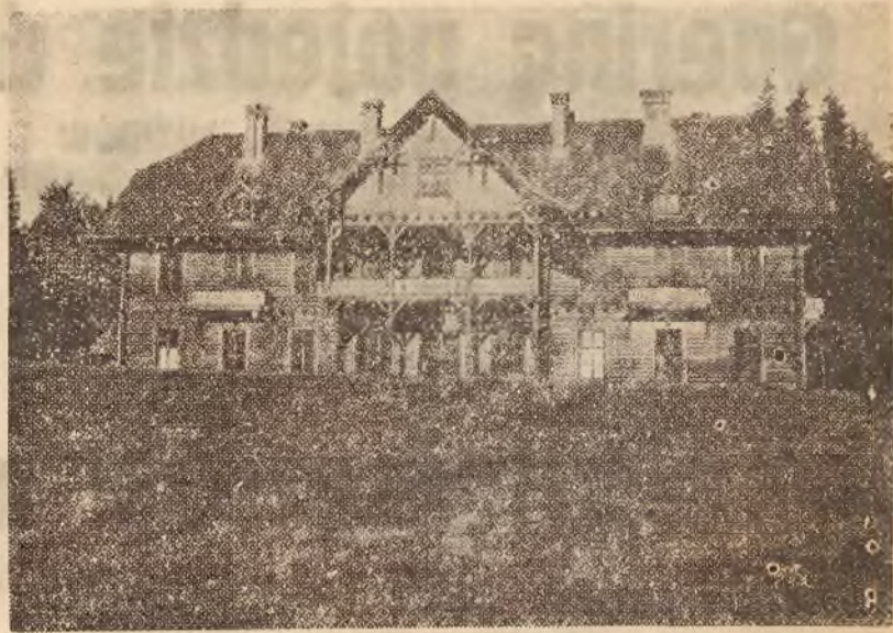
Na zdjęciu — zameczek myśliwski w Jaworzynie, najnowsza rezydencja Pana Prezydenta Rzeczypospolitej, w której Pan Prezydent spędza obecnie wraz z Rodziną wywczasny świąteczny.