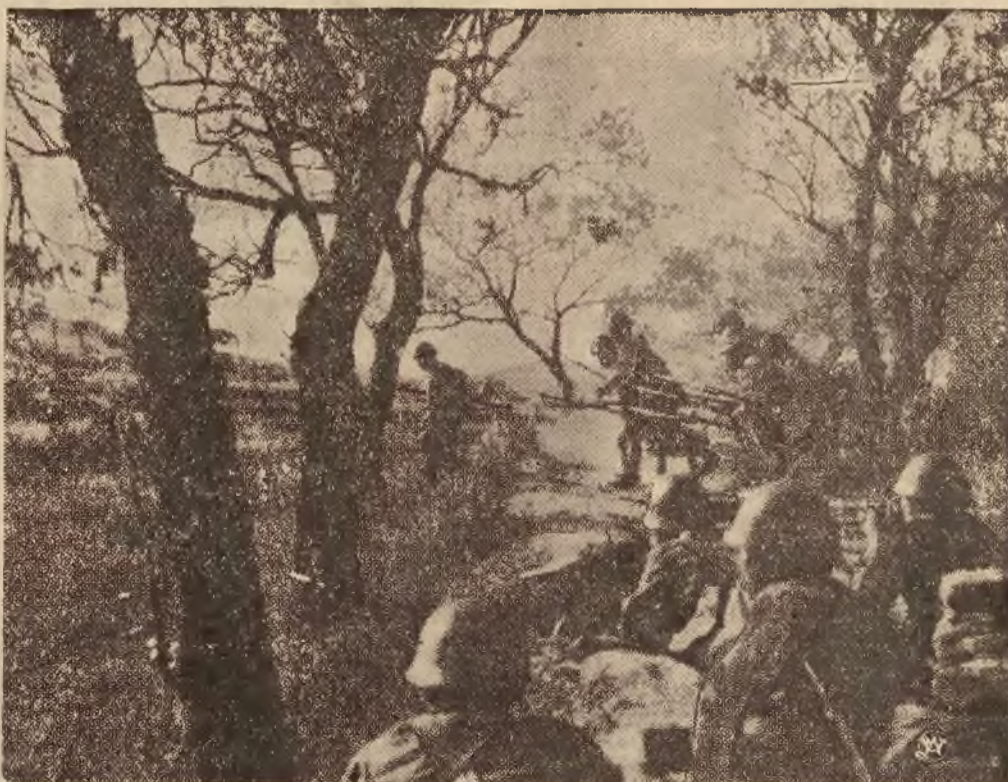
Na zdjęciu — oddział wojsk ja pońskich wraz z karabinami maszynowymi, podczas ataku na pozycje Marszałka Czang - Kai - Szeka pod Kantonem.