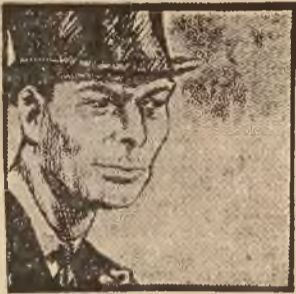
Król Jerzy VI

Cel ten został ostatecznie osiągnięty w październiku. Przez opanowanie Austrii, przyłączenie Sudetów oraz szeregu powiatów czeskich, wreszcie podporządkowanie sobie państwa cze-