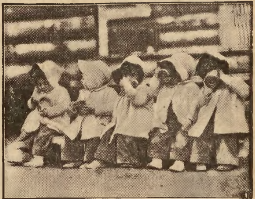
PIĘCIORACZKI KANADYJSKIE JEDZĄ, SNIADANIE NA POWIETRZU

Włochy podniosły pretensje do terytoriów francuskich, Niemcy żądają kolonii. Padają groźby i ostrzeżenia. Mocarstwa się zbroją w szybkim tempie. Horyzont niestety nie został oczyszczony z ciężkich chmur.