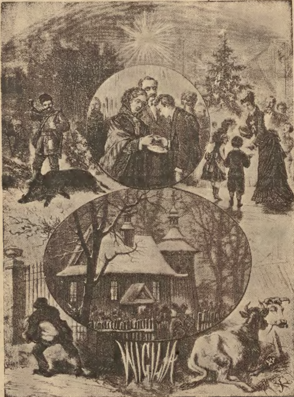
Wigilia polska — malował Juliusz Kossak.