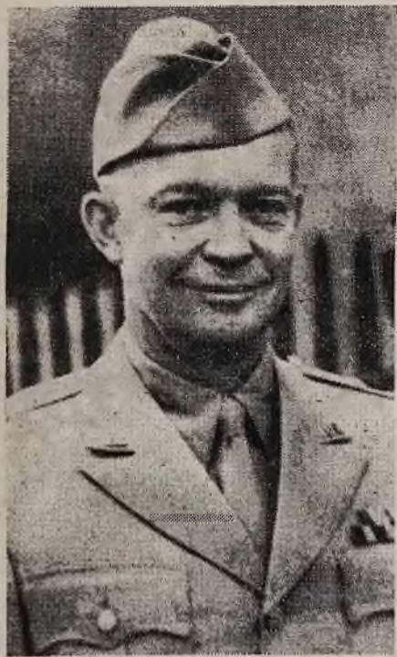
Gen. Dwight Eisenhower, wódz naczelny sprzymierzonych sił zbrojnych, które przed 11 miesiącami wyładowały w Bretanii, dzisiaj zaś obsadzają zachodnią potęgę powalonych Niemiec.