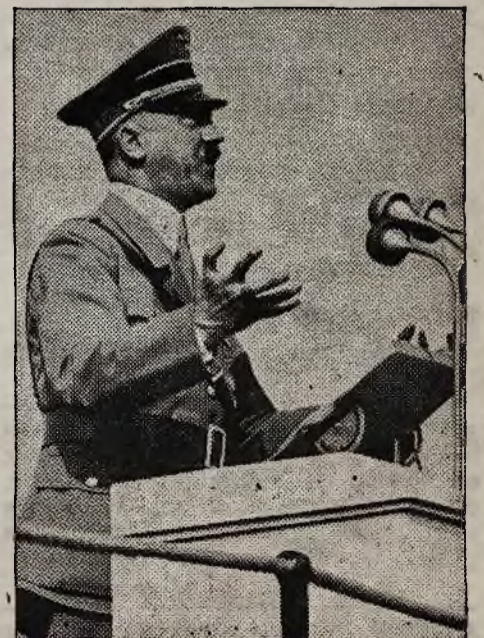
W pierwszym okresie pochodu ku potedze — i zgubie

Adam Sar.: List bez daty i miejscowości. Chętnie przeczytaliśmy opowiadanie „To co było” i jeszcze chętniej byśmy zamieścili, gdyby się nadawało. Niestety, rzecz jest rozlewna, a w gruncie rzeczy sprowadza się do czego? Nalot? Lecz ten nalot mógł być opowiedziany o wiele zwięźle i z większą ekspresją. Rozumiemy: dla Pana, który to przeżywał, każdy wyraz i ruch ma swoje znaczenie. Czytelnik jednak zapatruje się na te rzeczy inaczej i szuka przede wszystkim obrazu, akcji. Prosimy zatem o nową próbę — o ile Pan jeszcze zdąży.