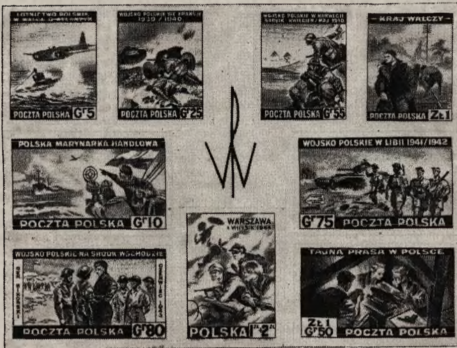
Seria znaczków, wydanych przez Pocztę Polską w W. Brytanii