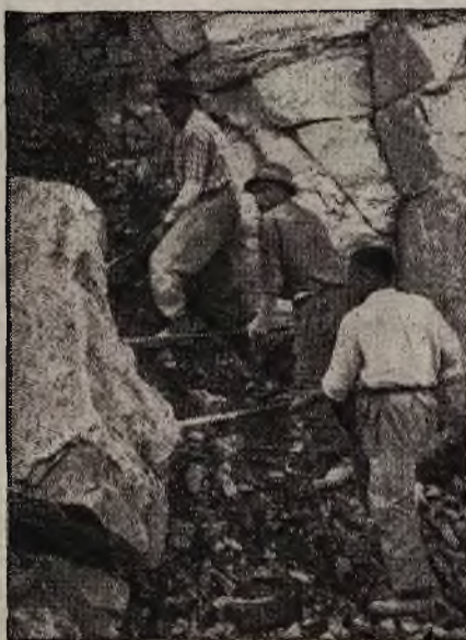
...usitują blok zepchnąć w dół...