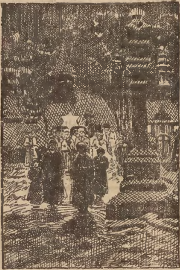
RYSUNEK SPORZĄDZONY WEDLE OBRAZU ARTYSTY-MALARZA PIOTRA STACHIEWICZA.