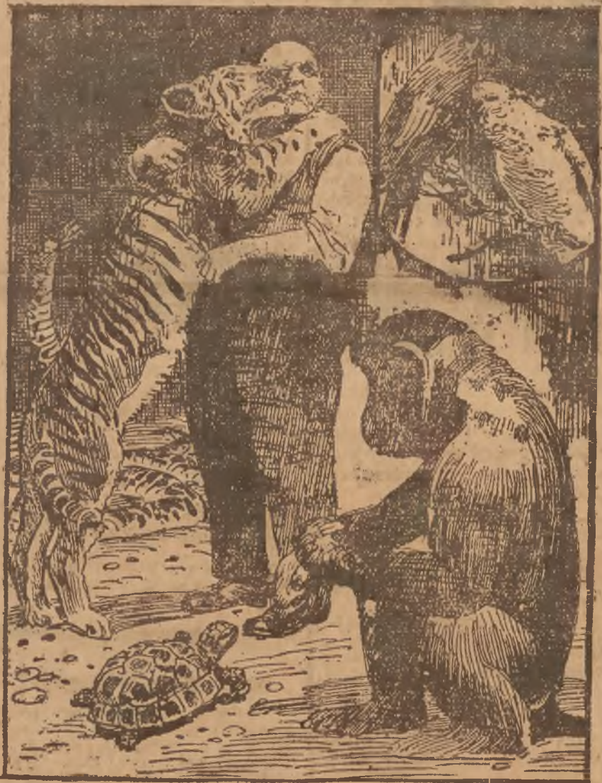
(Do artykułu na str. 7 p. t. „Człowiek, którego rodzina były zwierzęta.”)