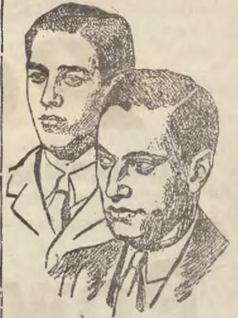
Ryszard Leeb (na lewo) i Natan Leopold.