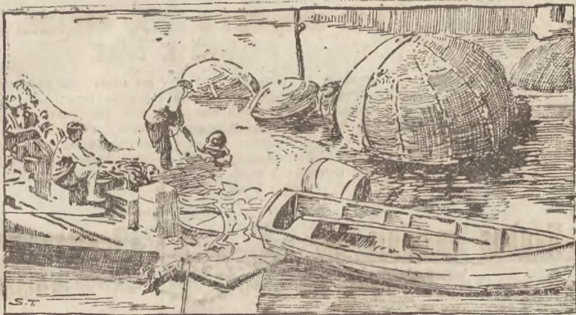
Pomyślni Amerykanie wynaleźli nowy i łatwy sposób wydobywania zatopionych łodzi i statków. Oto pod kadłub zatopionej łodzi podkłada się kilkadziesiąt olbrzymich gumowych balonów, płasko złożonych, a więc nie nadających gazem ni powietrzem. Następnie zapalnica przyczepionych do nich rur włącza się pompami do balonów tych lekki gaz. Balony powoli napełniają się gazem, wypływają coraz wyżej ku powierzchni wody, a na nich oparta zatopiona łódź razem z nimi sama zwolna wynurza się na wierzch.

To jest tło rozgrywających się obecnie w Chinach wypadków, tło lokalne, po za którym zmagają się