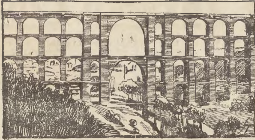
NAJWIĘKSZY WIADUKT ŚWIATA

Pierwszorzędna Kuchnia w porze obiadowej Obiady z trzech dań z 1 zł. — Wina, Wódki, Likieru i t. d. źródło Knappek. 7617