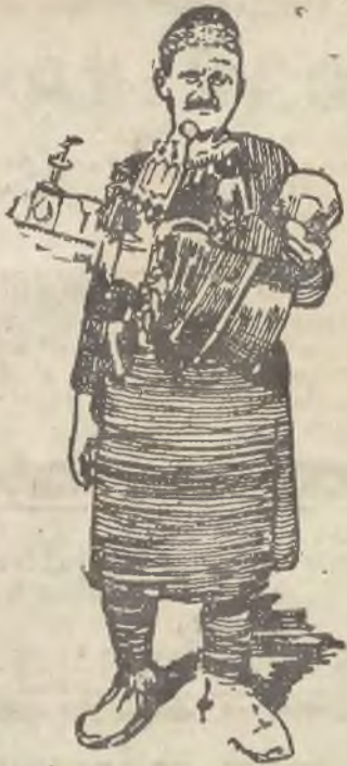
„Młczy sprzedawca lemoniady w Konstantynopolu.