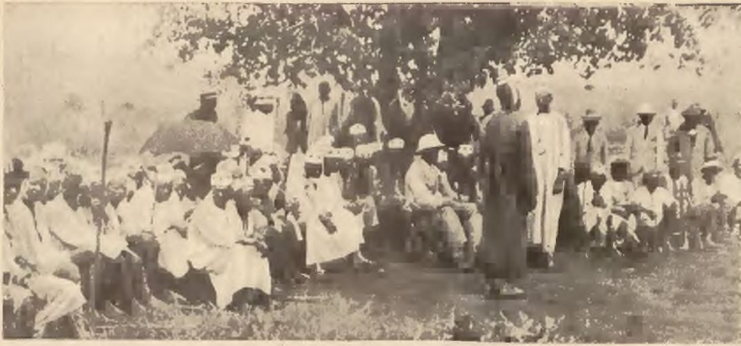
Scena z sądu murzyńskiego w Kamerunie (Afryka). Uwagę zwraca uroczyste przybranie murzynów, niektórzy z nich noszą nawet europejskie ubrania.