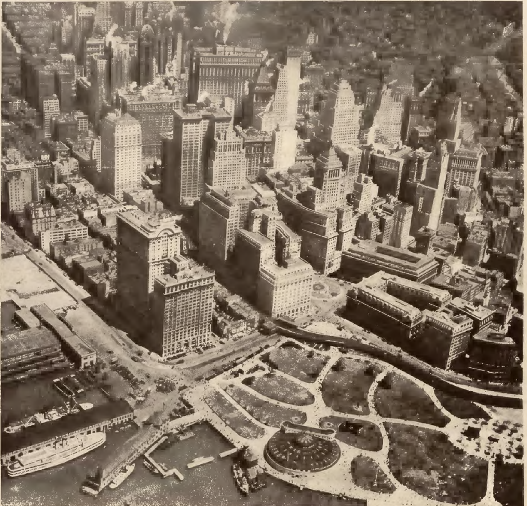
Widok z lotu ptaka na port nowojorski i dzielnicę Manhattan posiadającą największe drapacze chmur.