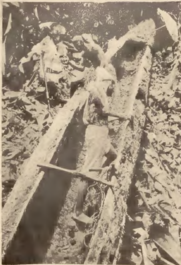
Budowa łodzi z pnia drzewnego przez krajowców na wybrzeżu Gujany w pld. Ameryce.