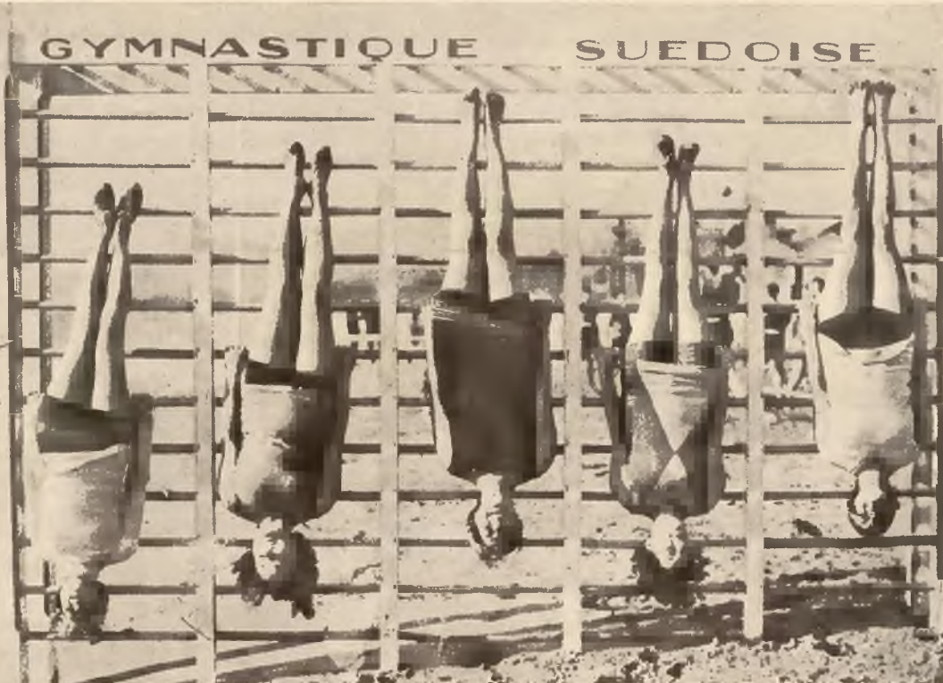
Kuracjuszki w Cannes uprawiają z zapałem gimnastykę szwedzką na wolnym powietrzu.

Na prawo: Girlsly jednego z baletów amerykańskich ćwiczą się w szermierce na tle malowniczych palm w Miami Beach na Florydzie.