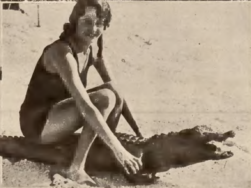
Kobieta i zwierzę. Słynne miejscowości kuracyjne na Florydzie dla uprzyjemnienia pobytu swym gościom wprowadzają rozmaite atrakcje, do których należą także tresowane bestje jak niedźwiedzie i krokodyle.