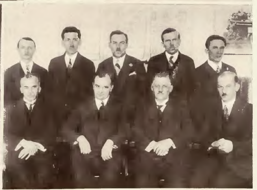
Pierwszy egzamin mistrzów budownictwa w Polsce odbył się w Państwowej Szkole Technicznej we Lwowie.