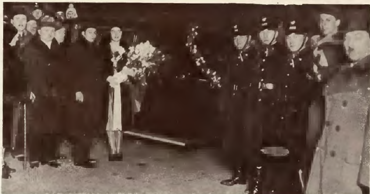
Powitanie Miss Polonji na dworcu kolejowym we Lwowie.