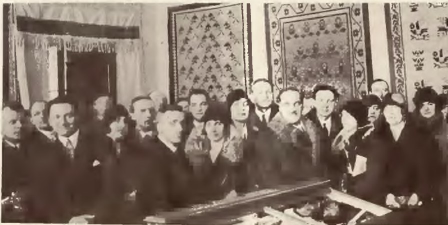
Otwarcie wystawy sztuki huculskiej we Lwowie.