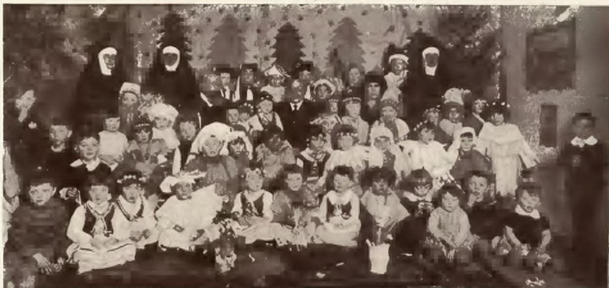
Przedstawienie w Ochronce lwowskiej przy ul. Kalecza 9.