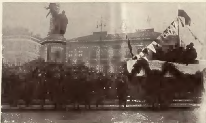
Na lewo: Inauguracja Tygodnia Pomorskiego we Lwowie. Podniesienie bandery na łodzi motorowej pod pomnikiem Mickiewicza.