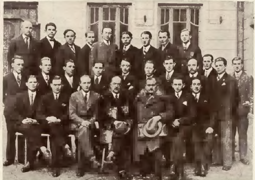
Zakończenie kursu krawieckiego przy Instytucie Przemysłowym we Lwowie.