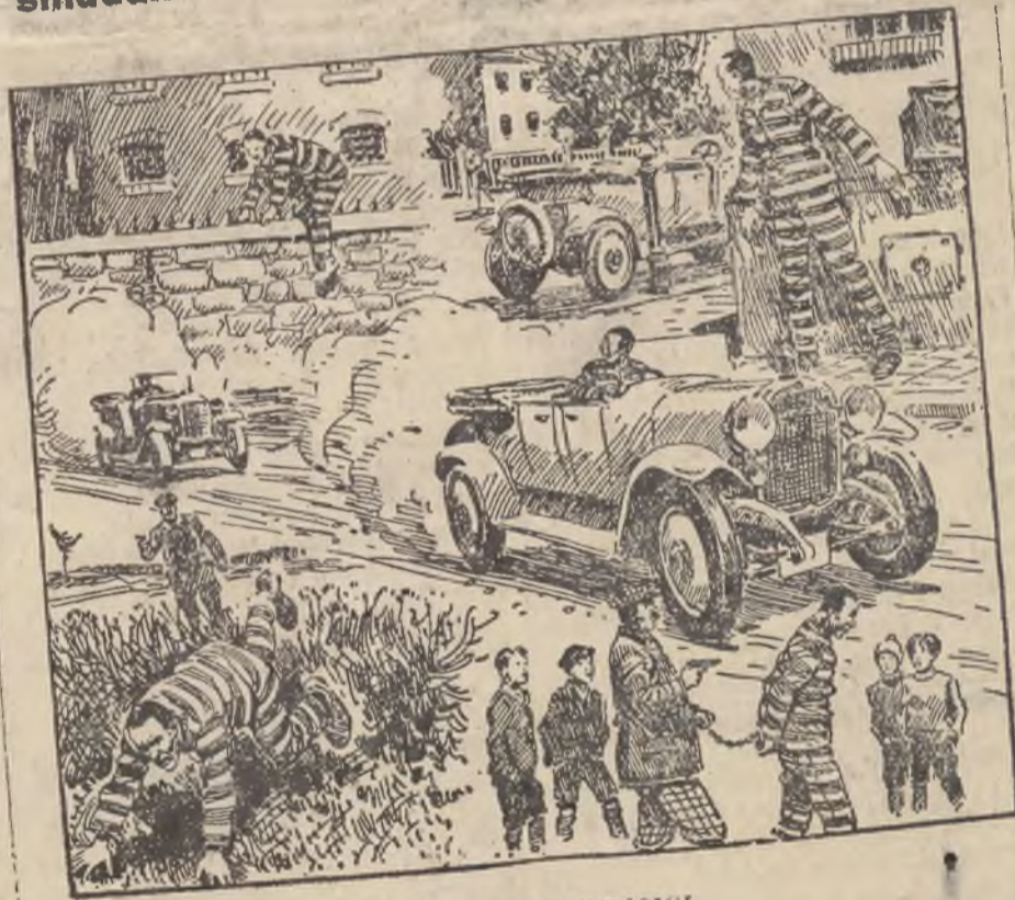
NIEZWYKLE WYSCIGI. (Do artykułu na str. 9-lej.)