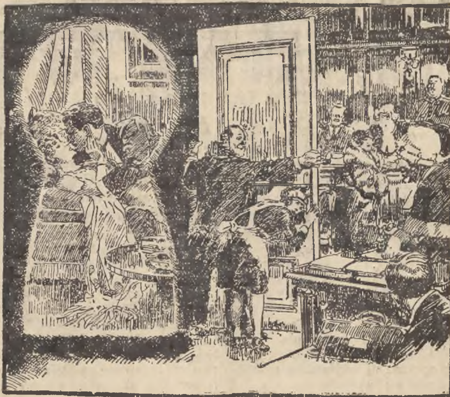
KOMEDJA W ŻYCIU. (Do artykułu na stronie 10-tej).

Sztokholm 17. lutego. (PAT.) Stan zdrowia królowej jest w dalszym ciągu ciężki. Wczoraj królowa przeszła długi i bardzo bolesny atak. noc jednak minęła dość spokojnie. Król pozostaje nadal w Rzymie