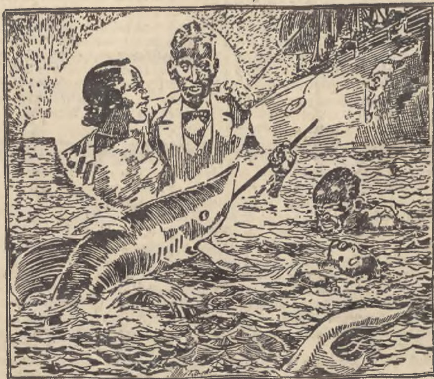
LUDOJAD JAKO SWAT. (Do artykułu na str. 9-tej.)