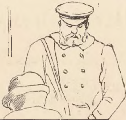
W wagonie III klasy.