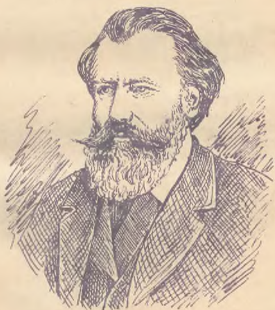
Jan Brahms znakomity kompozytor niemiecki. zmarły w Wiedniu.