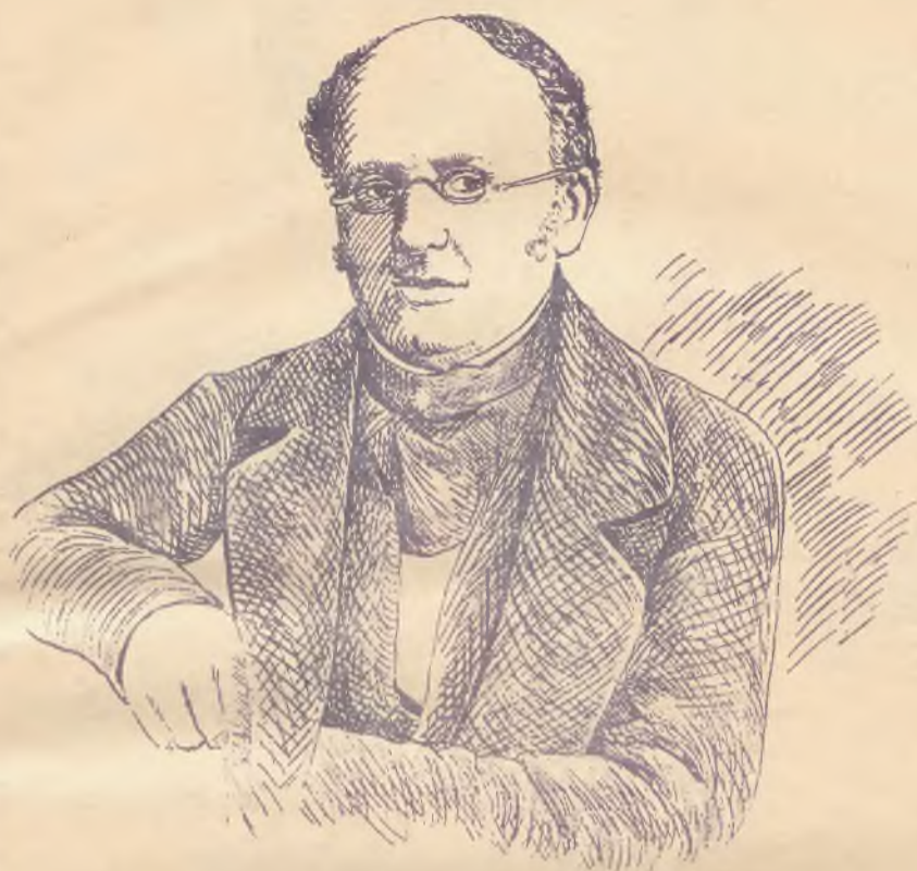
Józef Korzeniowski. z powodu setnej rocznicy urodzin.