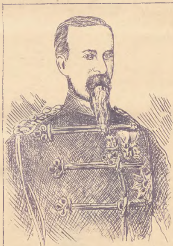
Pulkonnik Wassos dowódca wojsk greckich na Krecie.