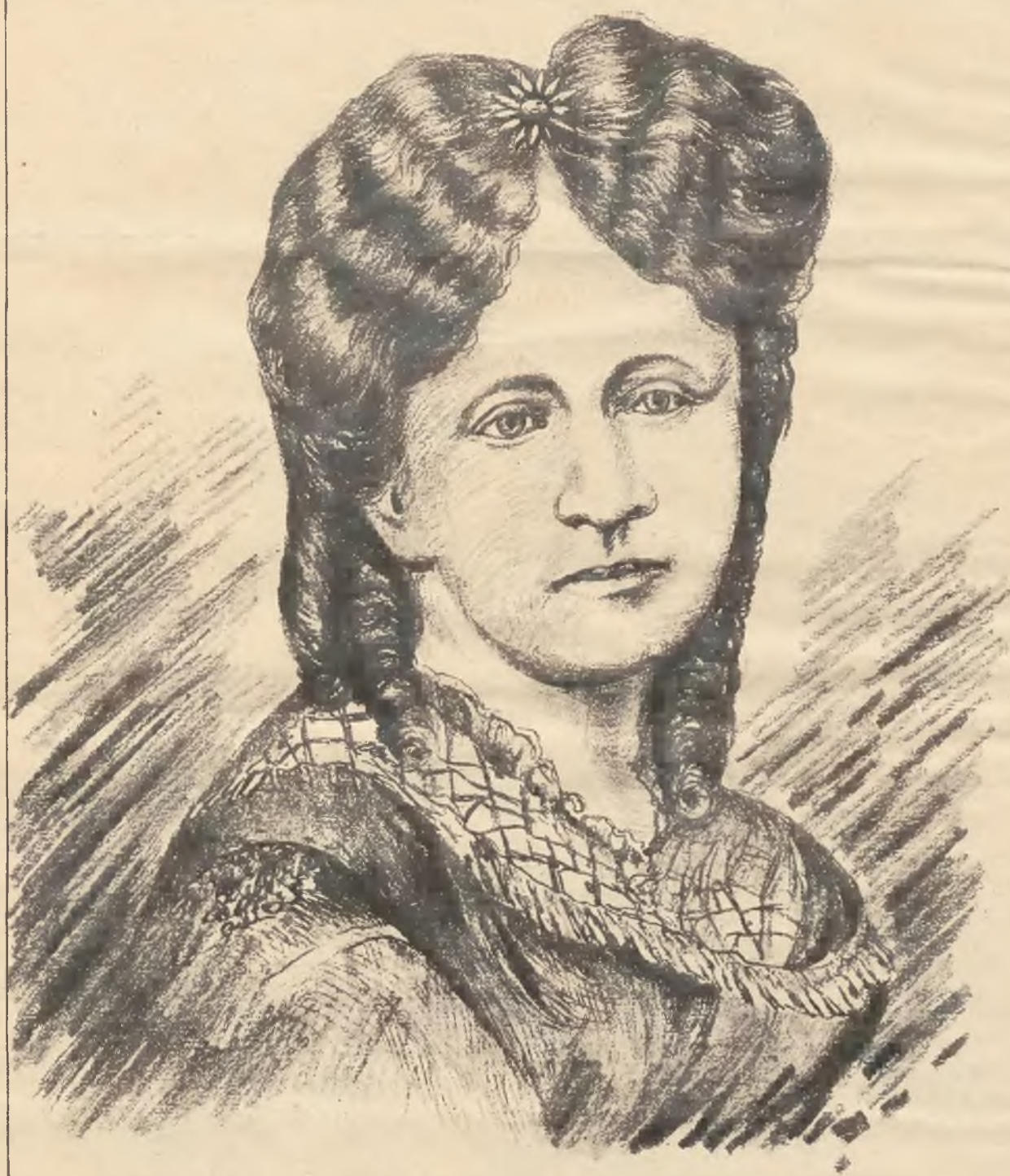
Deotyma (Jadwiga Łuszczewska)

Obchodząca obecnie czterdziesto-pięcioletni jubileusz poetycki w Warszawie.