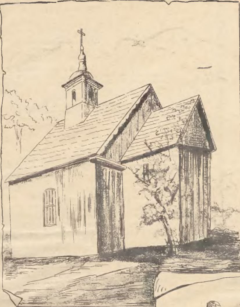
Kościółek św. Wojciecha na Zawodziu pod Kaliszem.

Jak podanie głosi, ko- ściółek ten zbudowano na miej- scu, gdzie św. Wojciech głosił słowo Boże i ofiarę Pańską składał.