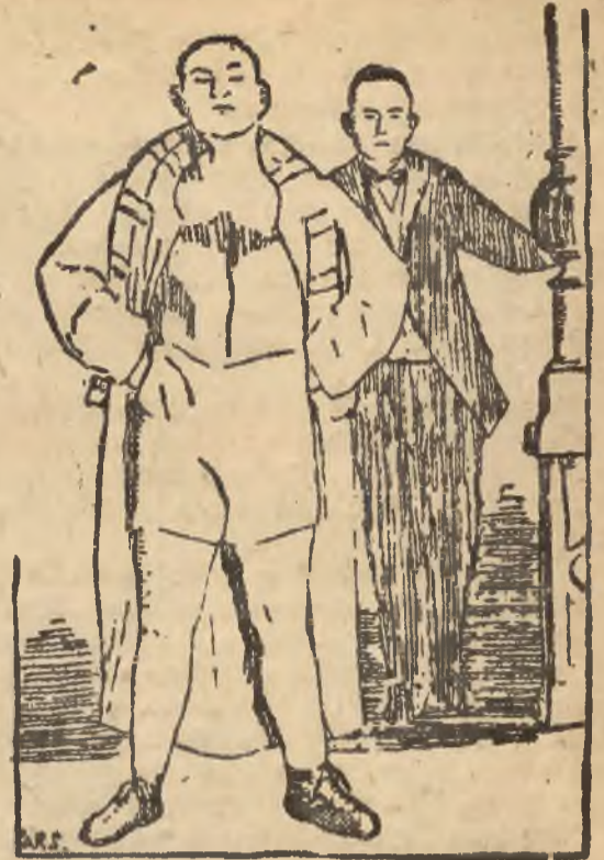
SABRI MAHIR, słynny turecki bokser.