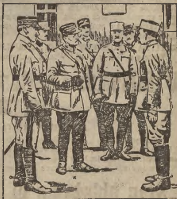
General Degoutte odbiera raport przy wejściu do Dusseldorfu.

jak i Niemcy. Niemcy będą zawiadomione pisemnie o tem, że w myśl londyńskiego planu politycznego mają zapłacić w dniu 31. stycznia 50 miliardów marek w złocie.