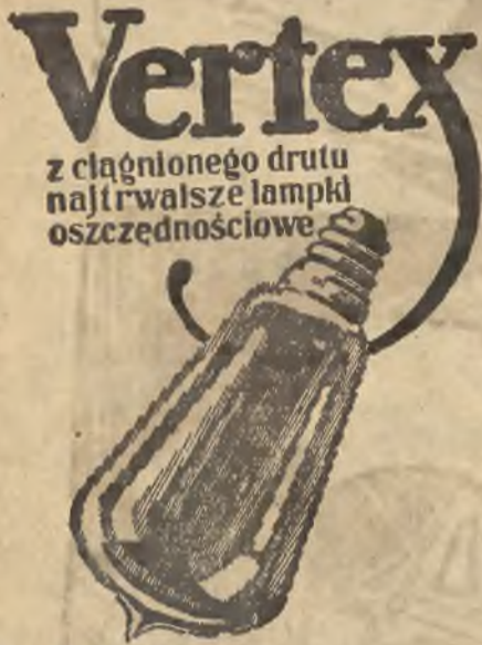
z ciągnionego drutu najtrwalsze lampki oszczędnościowe

Zakłady elektryczne „Vertex” Warszawa, Marszałkowska 91 70