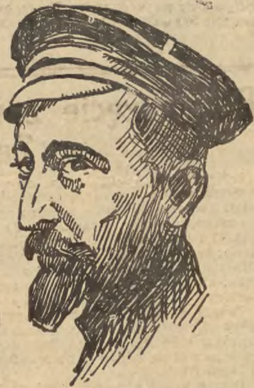
DZIERŻYŃSKI mający podjąć syzyfową walkę ze złodziejstwem w Rosji.

Ta „komisja centralna dla zwalczania korupcji kolejowej“ zakończyła już pierwszą