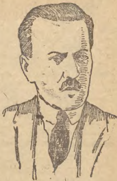
ALEKSANDER SKRZYŃSKI minister spraw zagranicznych.