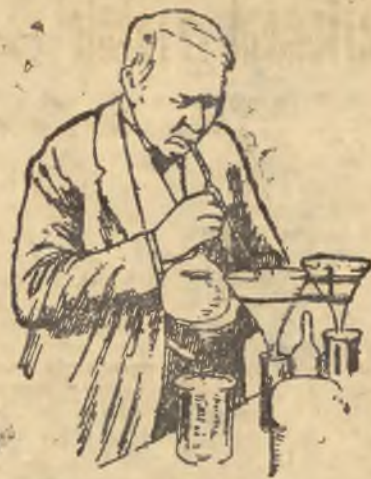
TOMASZ A. EDISON

słynny wynalazca amerykański, który niedawno temu obchodził 76 rok urodzin swoich. Rycina ta przedstawia Edisona w dniu rocznicy swoich urodzin, w którym to dniu pracował on w laboratorium przez 16 godzin.