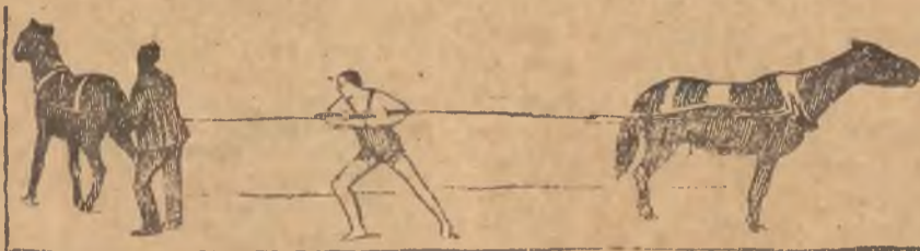
ATLETA TURECKI NIEZWYKLEJ SILY.

W jednym z cyrkow wędrownych w Persji opisuje sie atleta turecki niezwyklej sily. Jak rycina powyjsza przedstawia, utrzymuje on rękami dwa konie.