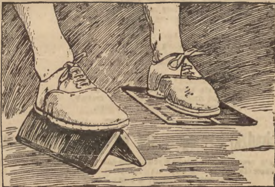
WYNALAZEK ULATWIA JACY PLYWANIE.

Pewien inżynier duński wynalazł oryginalny przyrząd, który przymocowany do nogi, otwiera się, wzgl. zamyka przy ruchach pływaka i znakomicie potęguje szybkość pływania, gdyż umożliwia silne odbicie się wody przy każdym ruchu.