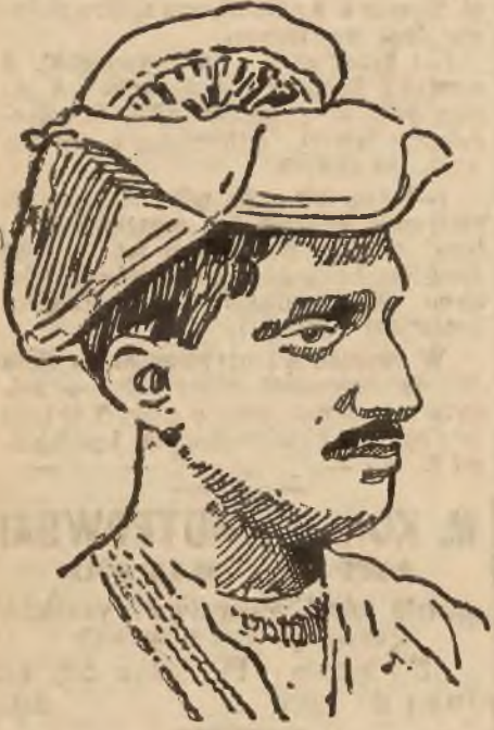
TAKOJI RAO, maharadża Indore.