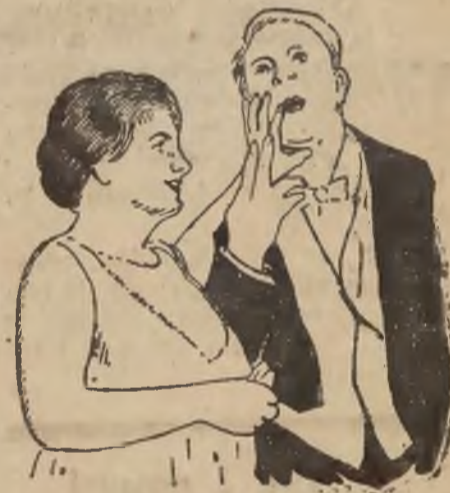
„SŁUCHA” SPIEWU ZAPOMOCĄ DOTYKU.

Teraz to się zmienia. Prosty dotąd bieg wspomnianej linii uległ skrzywieniu. A skrzywiła ją swym ciężarem brutalność niemiecka. Wyprawiała swym przyjaciółom i politykom tyle przykrych niespodzianek, że uznali za najmądrzejsze, stworzyć pomiędzy swym stanowiskiem a pretensjami Niemiec możliwie największy odstęp. Odstrzecznieli się, gdy, jakby dla zaдрwienia z ich dobrej wiary, Niemcy wybrały Hindenburga swym prezydentem. Skrzywili usta gdy polityka Stresemanna bez osłonek zagroziła rektyfikacją granic wschodnich. Co naturalnie mogłoby osiągnite być jedynie nową wojną. A świat ma już tych wojen dosyć. Anglia także. Włochy ditto. A już najbardziej je rozjuszyła najnowsza