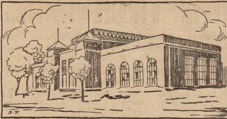
PAWILON WYSTAWOWY BANKU MAŁOPOLSKIEGO.