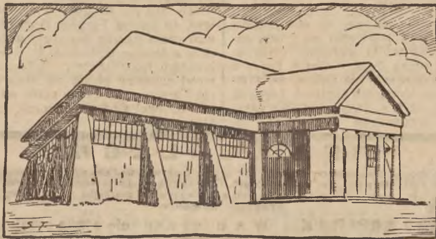
PAWILON ROLNICTWA I LEŚNICTWA.

z kupcami nieomal wszystkich państw europejskich i niektórych państw Bliskiego Wschodu azjatyckiego. Nie można wątpić, że kupiectwo nasze okazję tę wyzyska w całej pełni przez wszechstronny udział w V Targach Wschodnich.