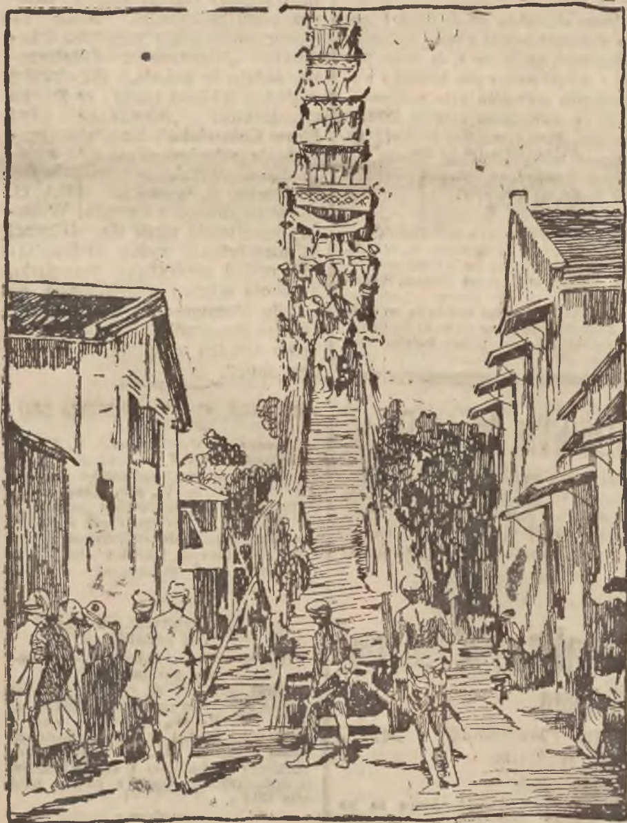
PIONIERZY MODNEGO SYSTEMU SPALANIA ZWŁOK. Budowa prymitywnego krematorium w miejscowości Bali na wyspie Sumatra, na którym zostaną spalone zwłoki naczelnika szczepu.