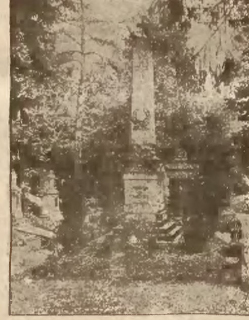
Grób poległych z r. 1863.