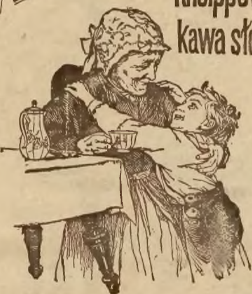
Babciu i matko też!

Znana od lat wielu jako najwyborniejszy dodatek do kawy zwyczajnej. — W cierpieniach nerwowych, sercowych, żołądkowych, niedokrwistości itd. przez lekarzy polecana. — Najulubieńszy napój kawowy u niezliczonych rodzin.