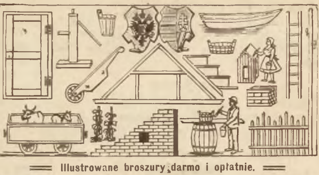
Illustrowane broszury, darmo i opłatnie.