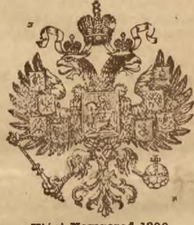
Niżni Nowgorod 1896.

Wystawa paryska 1900 roku „GRAND PRIX“ najwyższe odznaczenie!