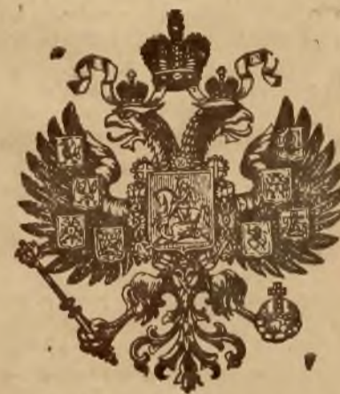
Nizni Nowgorod 1896.