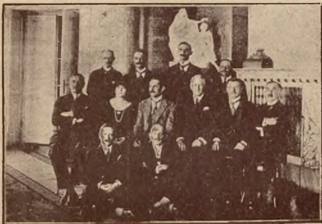
Członkowie polsko-węgierskiej konferencji kolejowej we Lwowie.