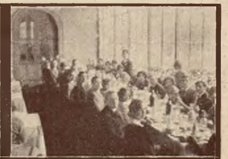
Bankiet pożegnalny w Sinaja.