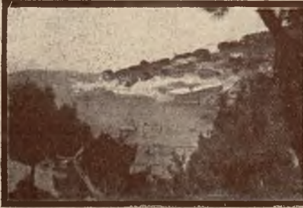
Wyspy książęce na morzu Marmara.