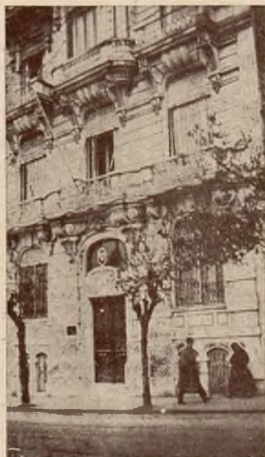
Gmach konsulata polskiego w Konstantynopolu.