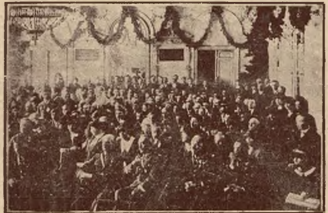
Posiedzenie delegatów Zjazdu w sali Ogniska oficerskiego.