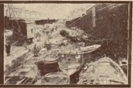
Port Galata w Konstantynopolu.