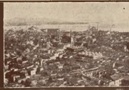
Konstantynopol z lotu ptaka.