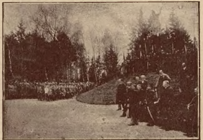
Hołd bohaterom racławickim przed pomnikiem Bartosza Głowackiego w parku Łyczakowskim.