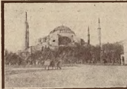
Meczet Agja — Sofja.