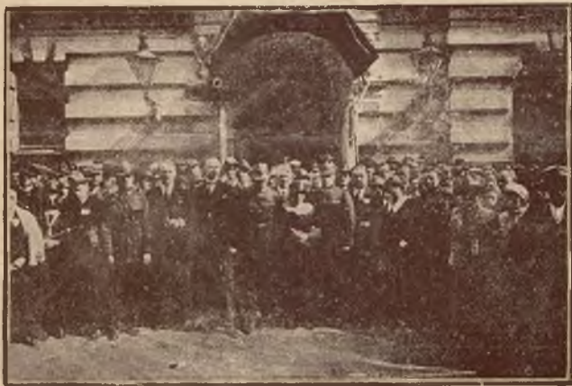
Przed gmachem Ogniska ofic.