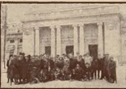
Przed parlamentem rumuńskim.