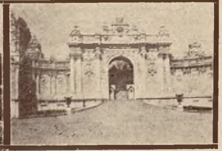
Brama przed pałacem Dolma Bagdzie.