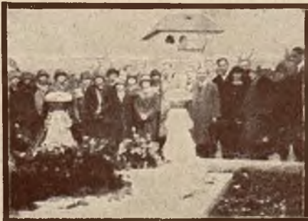
Złożenie wieńca na grobie Nieznanego Żołnierza w Bukareszcie.