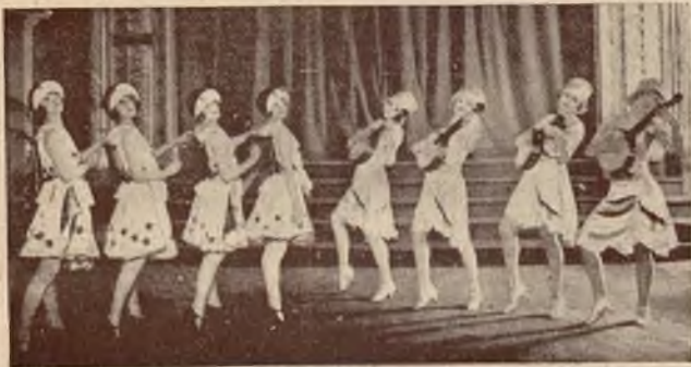
Angielska rewia muzyczno-beletowa Knock-Knock-Knock.