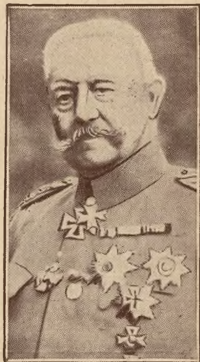
Feldmarszałek Paul von Beneckendorff und Hindenburg — prezydent Rzeszy niemieckiej.