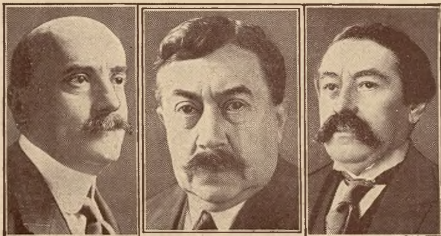
Najwybitniejsi członkowie rządu francuskiego: Minister Skarbu Caillaux, Premier Painlevé, Min. Spr. Zagr. Briand.