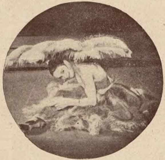
Mis Mille Terpsichore, nadworna baletnica w Londynie w swej najnowszej kreacji.