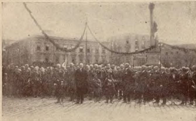
Przedstawiciele władz i instytucji podczas defilady.