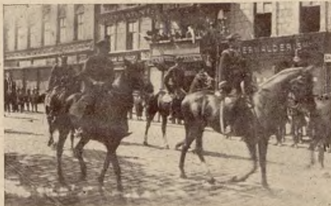
Gen. Thullie na czele defilady.