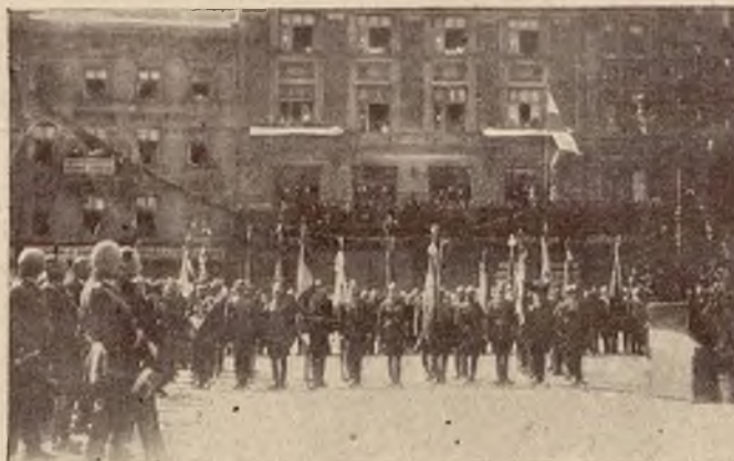
Sztandary poszczególnych pułków przed ołtarzem polowym.