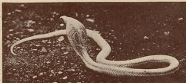
Automatyczny aparat fotogr. na usługach nauki. Powyżej widzimy zdjęcie okularnika, dokonane tymże aparatem.