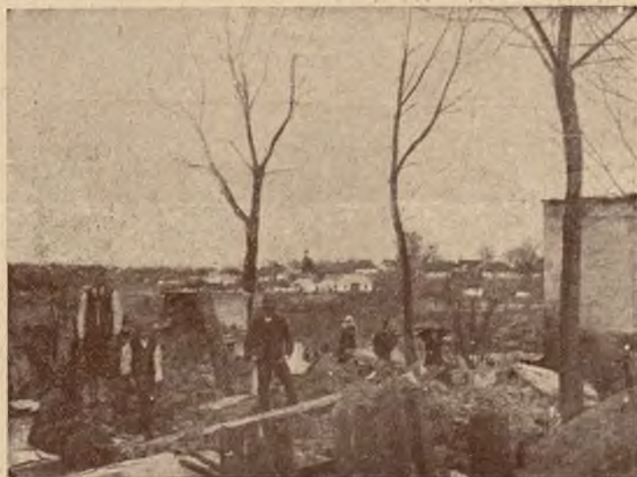
CHOROSTKÓW PO POŻARZE. Jedna z głównych ulic po pożarze.