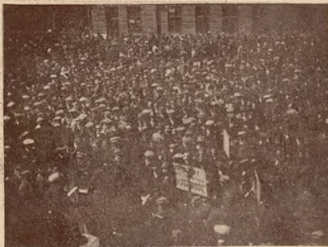
Zebranie na placu Gosiewskiego we Lwowie w dniu 1. maja b. r.