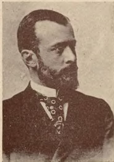
Prof. dr. Leon Piniński.