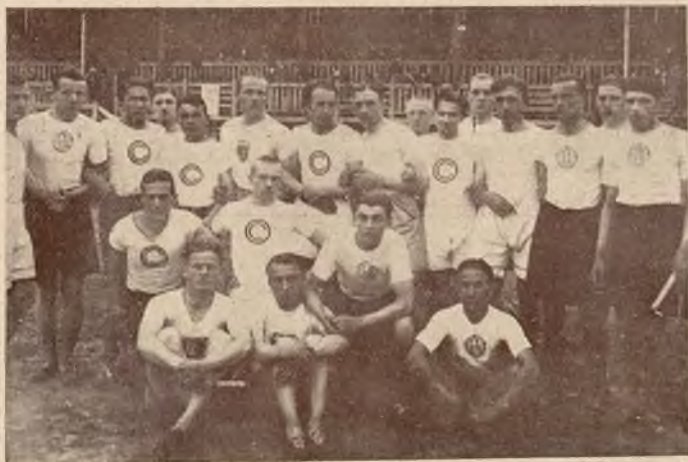
Bieg rozstawny olimpijski drużyn Pogoni, Czarnych i A. Z. S.