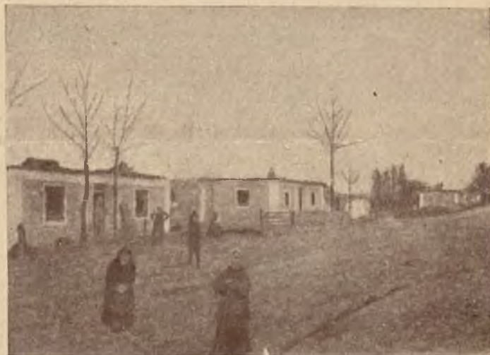
Pogorzelcy na ruinach przystępują do pracy nad nowymi osiedlami.