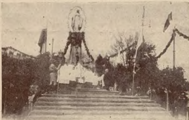
Msza polowa na placu Marjackim.