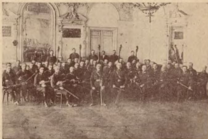
Koncert symfoniczny orkiestr wojskowych w Ognisku oficerskim we Lwowie.