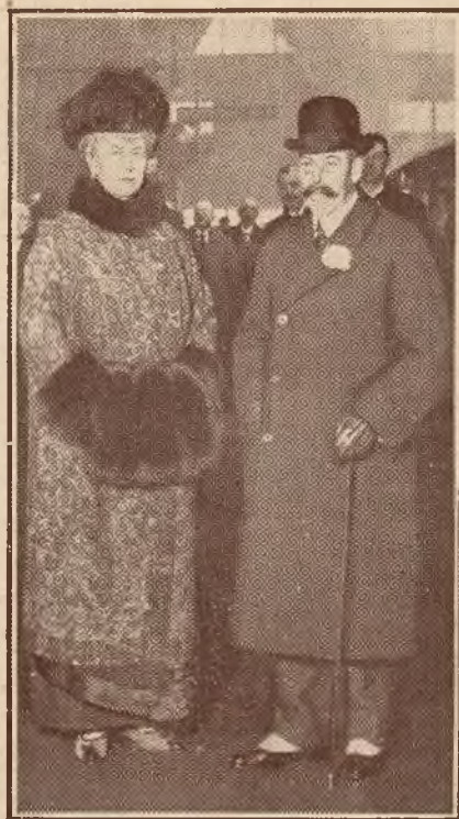
Królewska para angielska, podczas swej podróży po Morzu Śródziemnym.