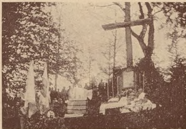
Poświęcenie kamienia węgielnego pod ochronkę przy Seminarjum gospodarczym w Snopkowie pod Lwowem.