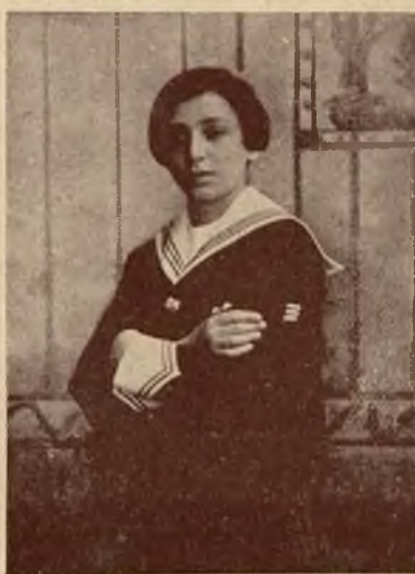
Bronisław Gimpel, skrzypek.