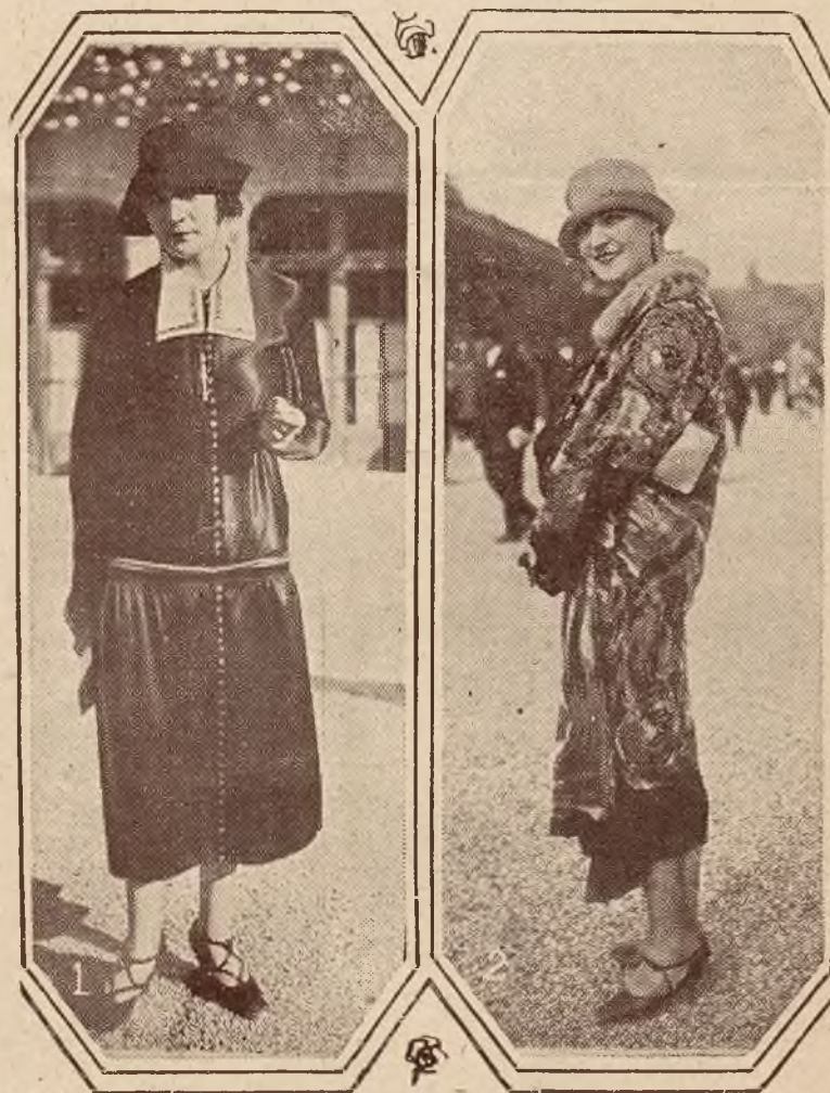
Z wyścigów w Longchamps. Wyścigi pozostają zawsze pierwszorzędną rewją mody. Na rycinie naszej widzimy dwa zdjęcia ze słynnych wyścigów w Longchamps. 1. Suknia z ciemnego materiału, kaska, zapinana z przodu na drobne guziczki z kołnierzem i mankietkami z białej organdy. 2. Luksusowy płaszcz z materiału burafil, futrem przybrany.