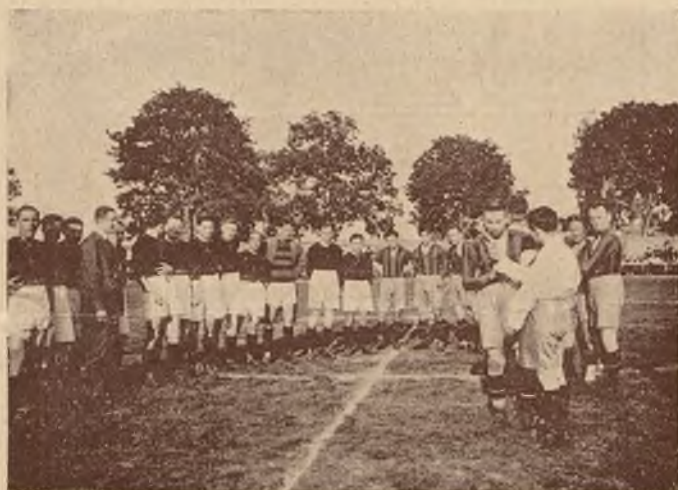
Otwarcie sezonu L. T. K. i M. we Lwowie. — Raid przez miasto.