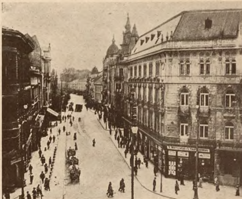
Ulica Akademicka we Lwowie, której projekt regulacji wywołał ożywioną dyskusję.

Nowy dyrektor teatrów miejskich we Lwowie L. Schiller de Schildenfeld.