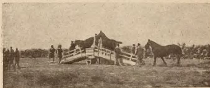
Popisy siłacza Zygmunta Breitbarta na boisku Hasmonei.