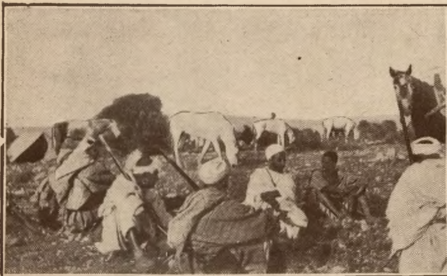
Z pola walki armii francuskiej w Marokku. Techniczne oddziały armii francuskiej rozłokowane na linii Kiffane a Aiu-Maatouj.