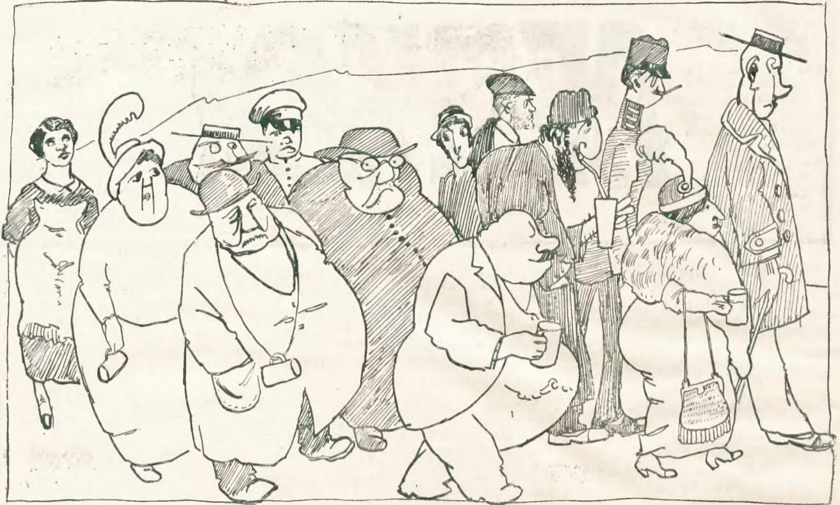
„ПАНЬСТВО“ ВЪ КРЕНИЦИ НА СЕЗОНЪ.