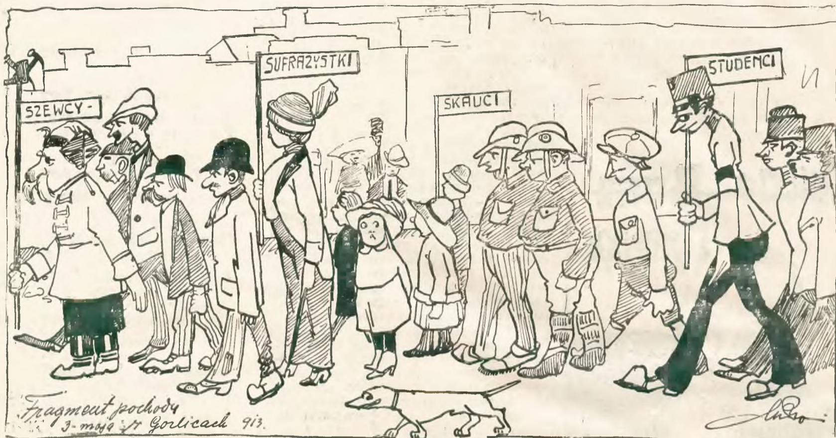
Походъ польской бойовой арміи въ Горлицяхъ.