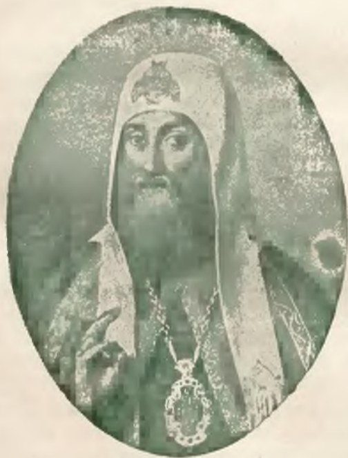
Смирный. Ермогенъ Патриархъ.

Триста лѣтъ тому назадъ, 17. фев- раля 1612 года, въ мрачномъ и тѣсномъ подземельѣ Московского Чудова мона- стыря, мучениски угасъ яркій свѣтильникъ церкви русской и усердный молитвенникъ и печальникъ зя народъ русскій, великій праведникъ — святѣйшій патриархъ все-