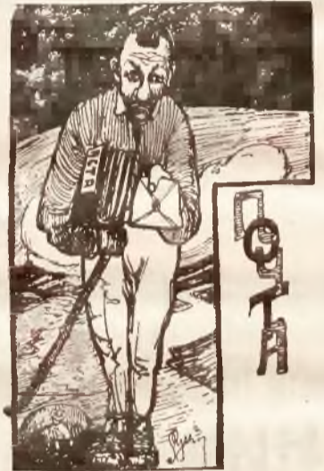
Сусѣдцѣ Rittera Косыця.

Препрашае Васъ барзѣ гардѣ, але не можеме гандлювати старыми книжками, мы лемъ збераме а пакъ якъ ся окажуть потребны даеме до дальшого розпоряджыня, а пѣзнѣйше вертаме назадъ.