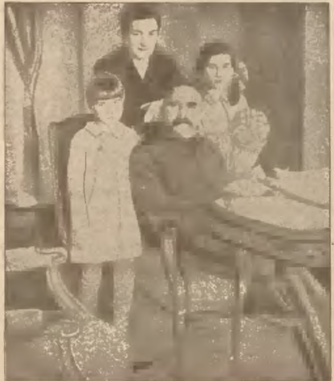
Marszałek Józef Piłsudski na łonie rodziny, z Żoną swoją i córeczkami.

ści za powodzenie polityczne i wojskowe sprawy, a chociaż niektórzy zbyt sceptycznie patrzyli na Jego wielkie poczynania, to okazało się później, że tylko On miał rację i Jemu należy zawdzięczać wszelkie nasze dzisiejsze sukcesy. Inna rzecz, że Józef Piłsudski mógł oprzeć się zawsze na tych swoich najwierniejszych, którzy stali zawsze przy Jego boku, posłusznie słuchając wszelkich rozkazów, pełni wiary, że są one dobre i nieomyłne.