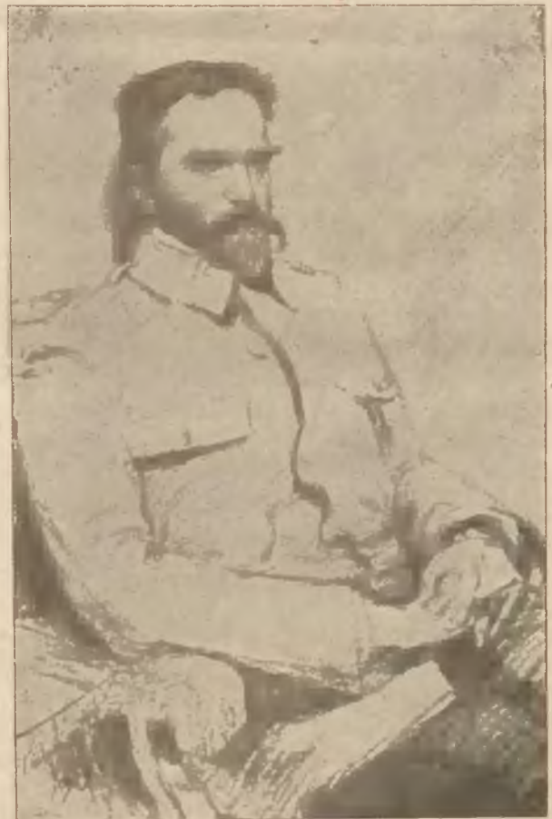
Józef Piłsudski bezpośrednio przed wybuchem wojny światowej. Й. Пілсудський безпосередно перед вибухом всевітньої війни.

W onym czasie mocarstwa europejskie połączyły się w dwie grupy. Jedną, tak zwanego trójporozumienia, tworzyły Francja, Rosja i Anglja, — do grupy zaś drugiej, trójprzymierza, należały Austrja, Niemcy i Włochy. Główne przeciwieństwa i sprzeczne inte-