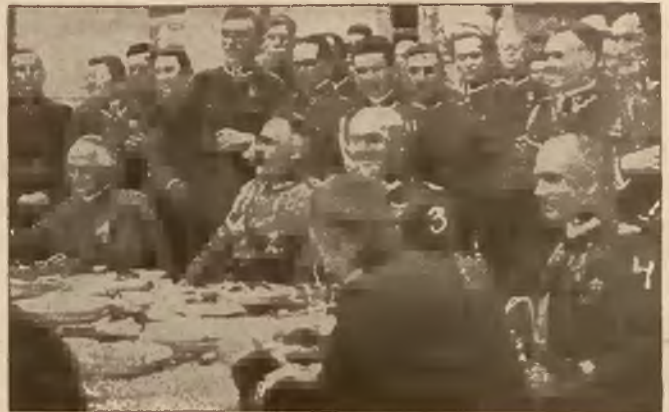
Biesiada żołnierska, w której biorą udział: Ks. Biskup Bandurski (1) i Marszałek Pilsudski (2).