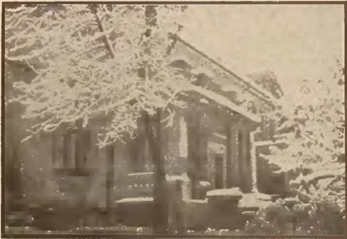
Dom rodzinny Józefa Piłsudskiego w Żulowie (Wileńskie). Родинний дім Й. Пілсудського в Жулові (пов. Віленський).

Zaciągnięty dalej do pracy organizacyjnej, a czując zbliżającą się wojnę rosyjsko-japońską, wybiera się do Królestwa, Litwy, Rusi i Rosji, a wreszcie do Japonji, chcąc wywołać ruch powstańczy, jednakowoż plany Jego sparaliżował Dmowski.