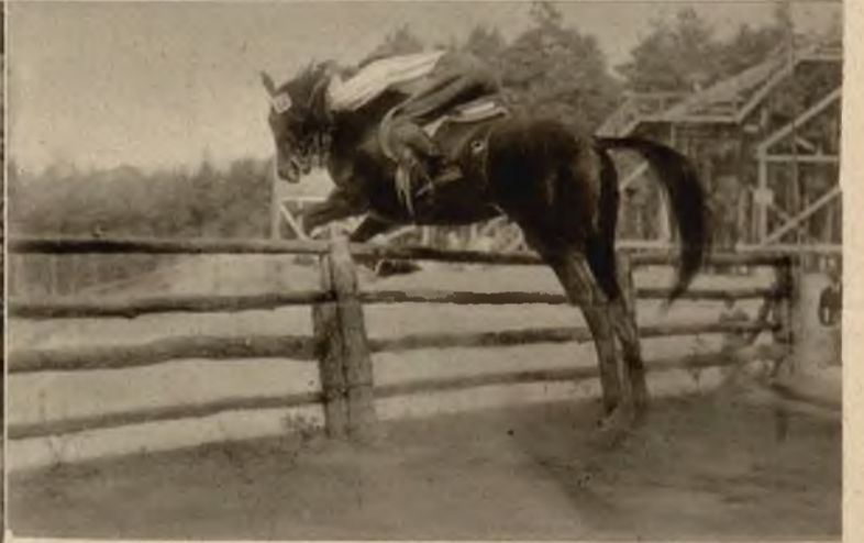
Skok w próżnię. Interesujące zdjęcie z tresury koni przygotowywanych do Olimpiady.