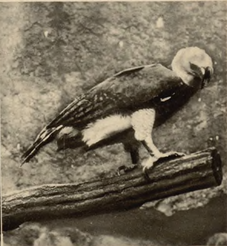
Harpja, niezwykle rzadki okaz ptaka drapieżnego, żyjącego w Brazylii, znajduje się w zwierzyńcu londyńskim.