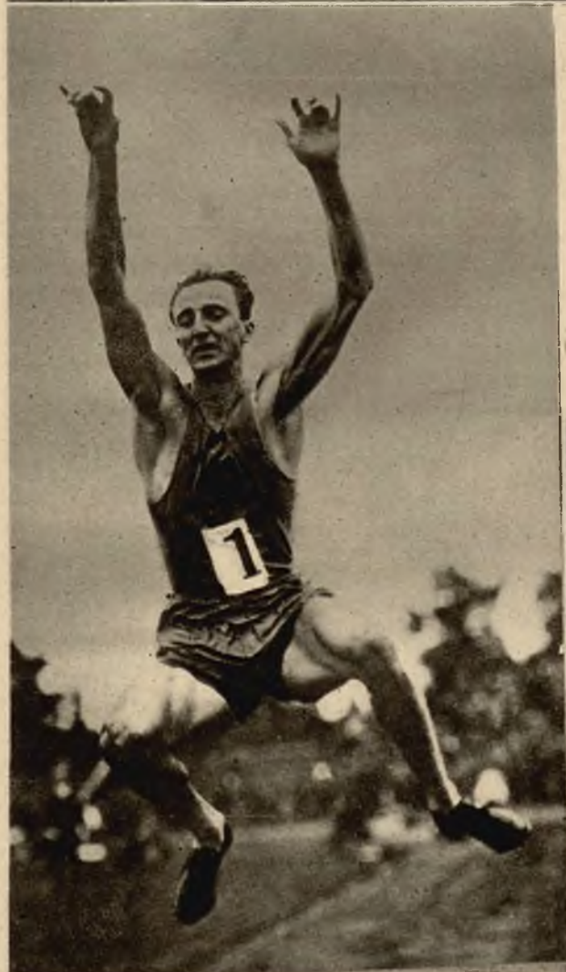
Mistrz świata, Szwed Petterson w wspaniałym skoku w dal.