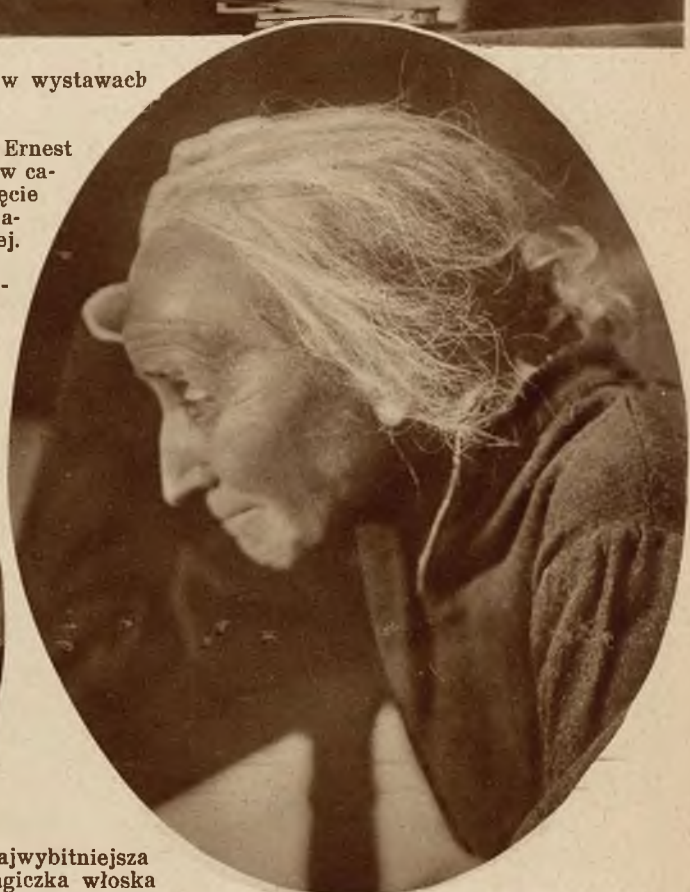
Najwybitniejsza tragiczka włoska Emma Grammatica.