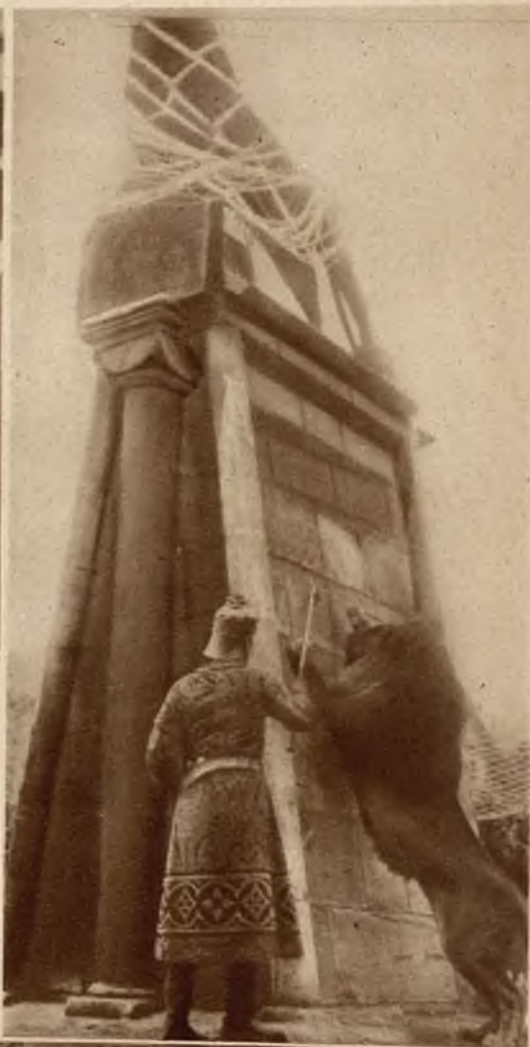
Na prawo: Cyrk Sarrasani bawiący w Brunzwicku urządził kłatkę na lwy naokoło pomnika Henryka Lwa, znajdującym się na publicznym placu w środku miasta.