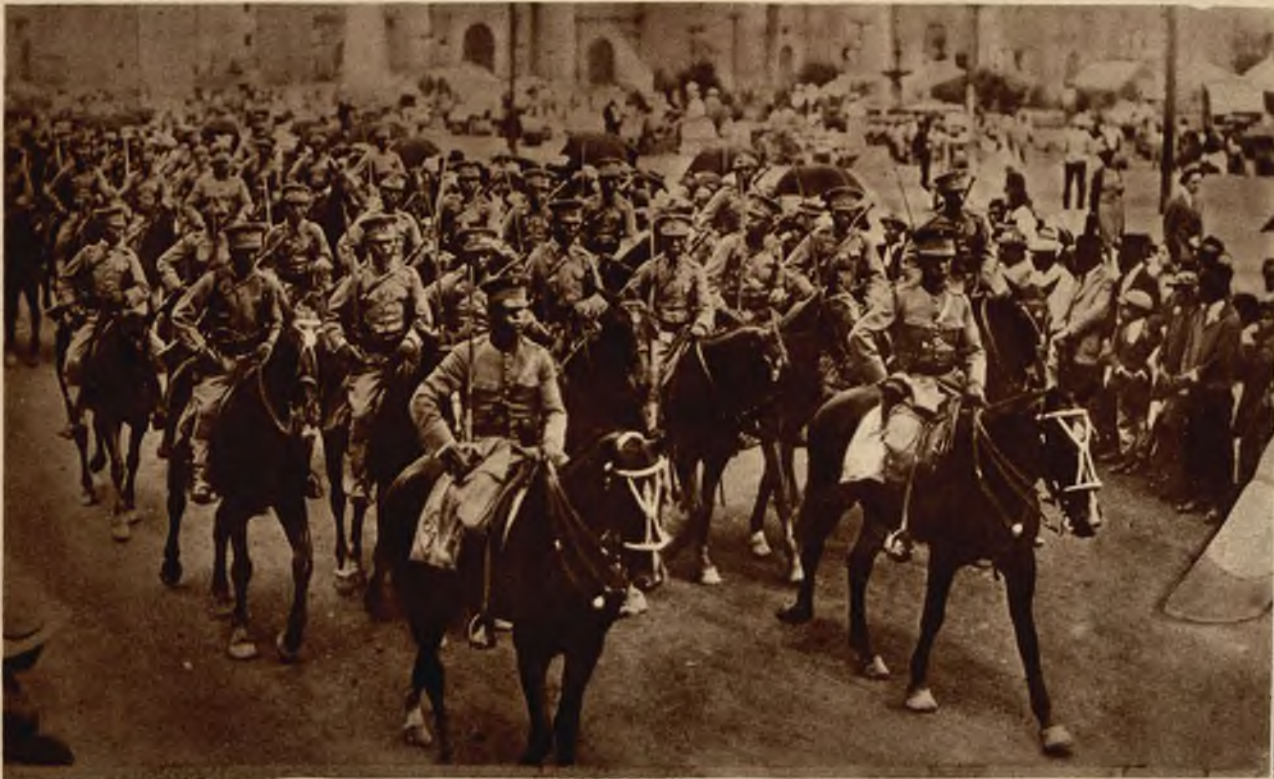
Prezydent Meksyku Calles, przeprowadził reorganizację armji, która obecnie tak pod względem materiału jaki wyekwipowania robi bardzo dobre wrażenie.