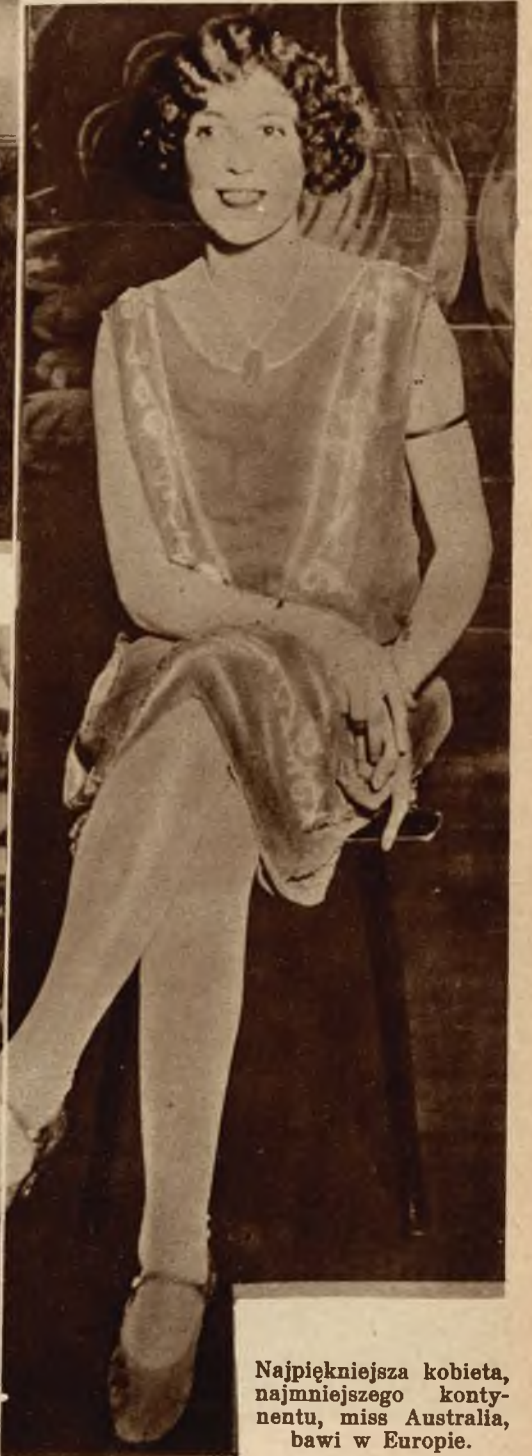
Najpiękniejsza kobieta, najmniejszego kontynentu, miss Australia, bawi w Europie.