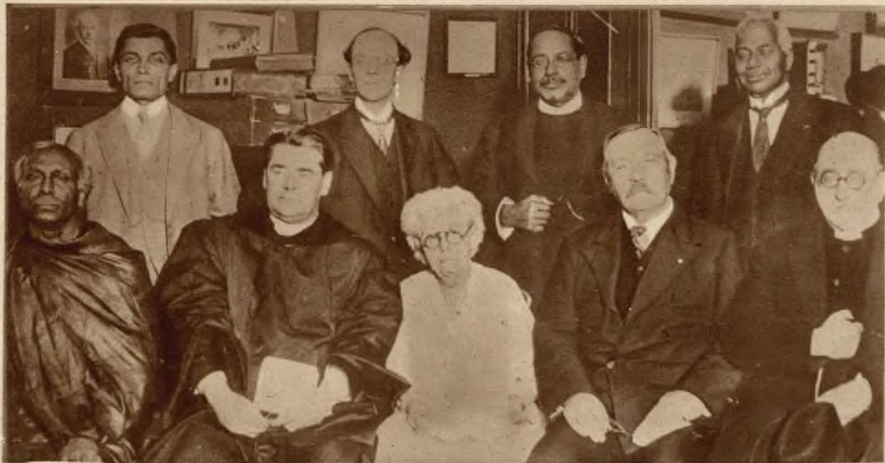
W Londynie odbyła się konferencja delegatów wyznań nie chrześcijańskich, w której wzięła także udział słynna teozofka dr. Annie Besant.