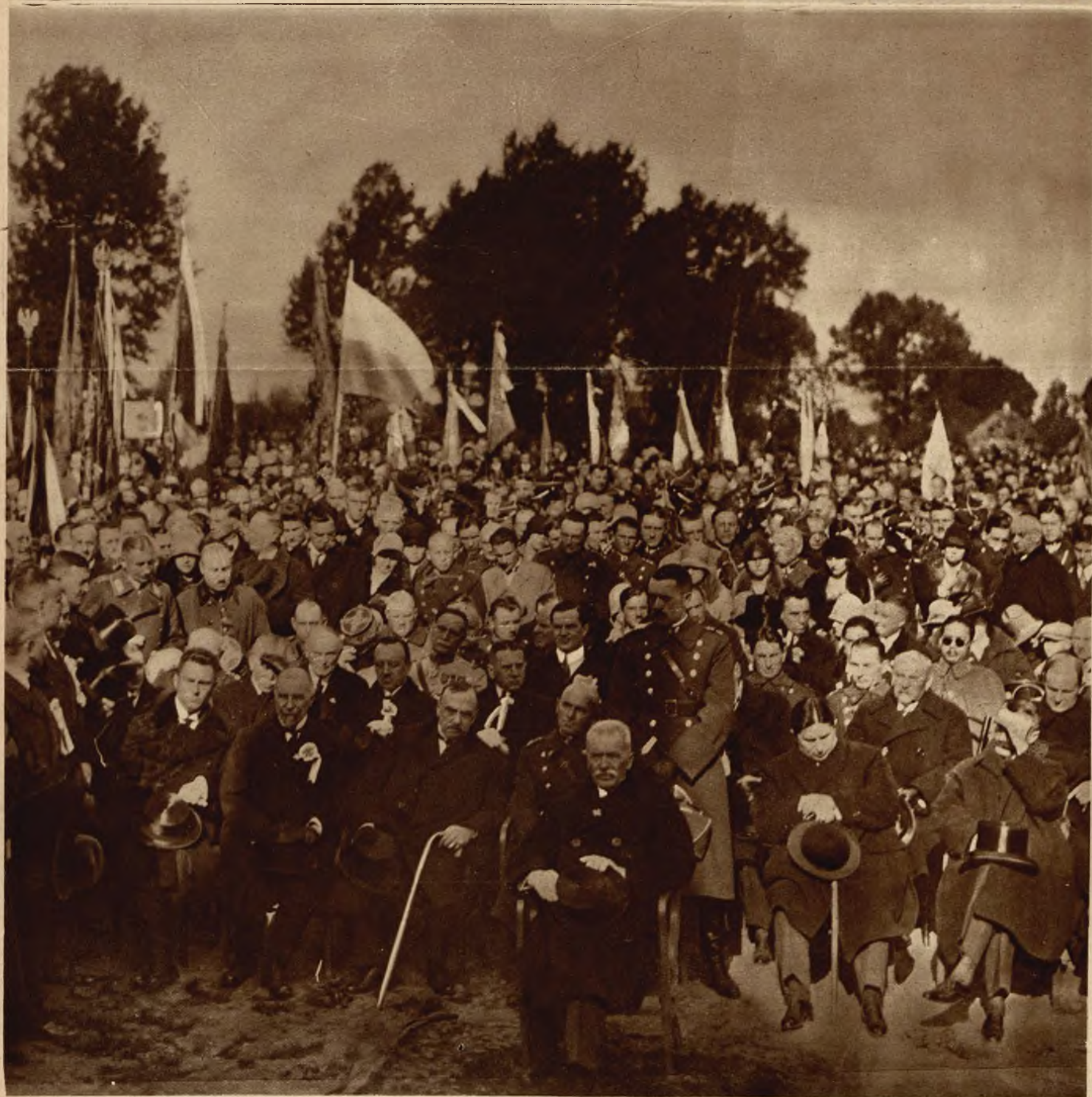
Uroczystości w Radzyminie na cześć poległych w r. 1920 w wojnie z bolszewikami. P. Prezydent Mościcki z generalicją, członkami Rządu oraz reprezentantami ciała dyplomatycznego w czasie mszy.