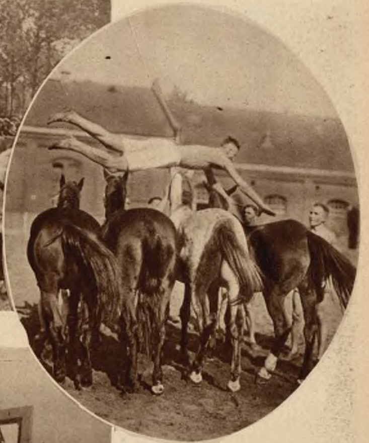
Ćwiczenia policji konnej. Skok przez 4 konie.