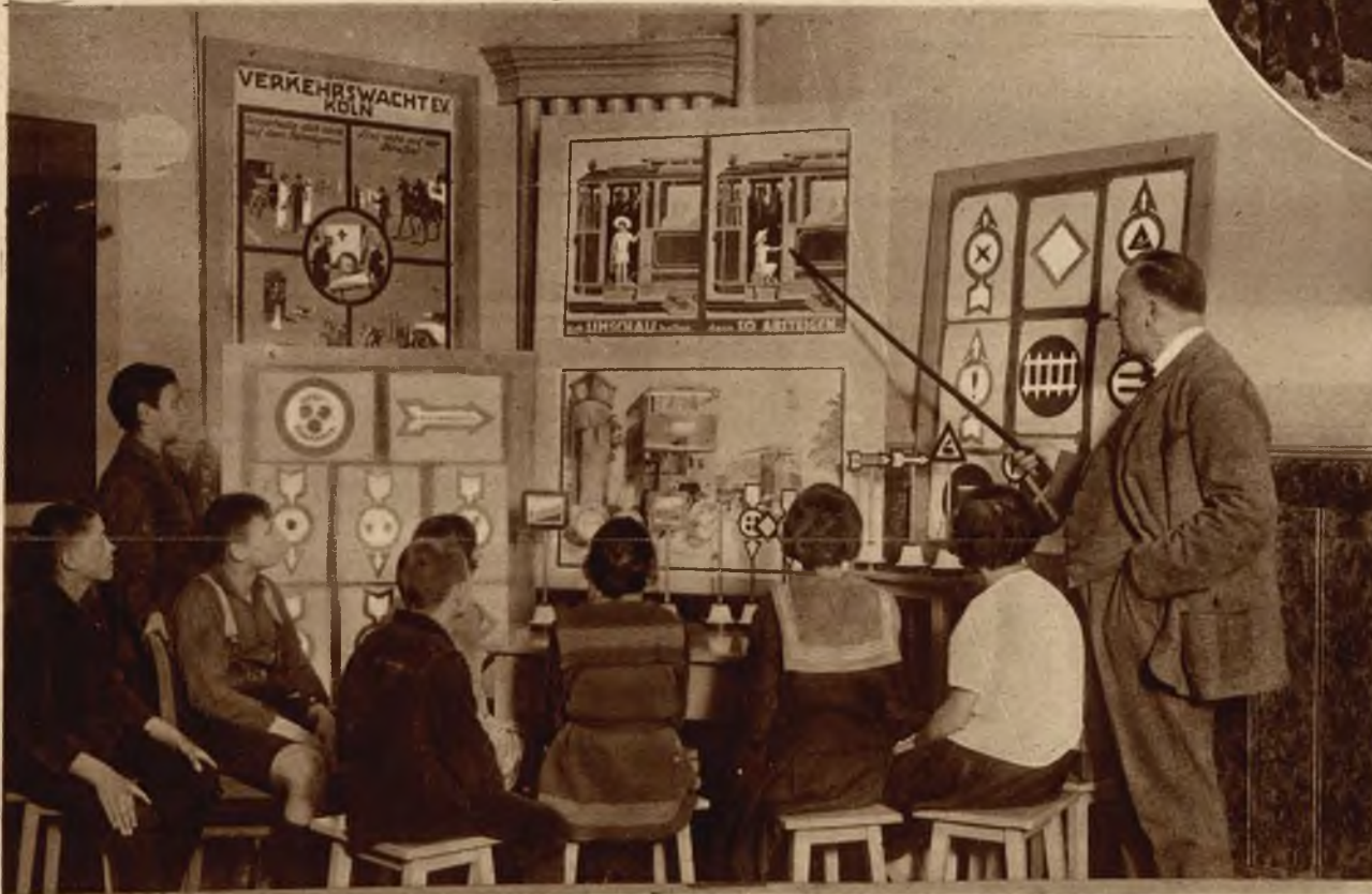
W berlińskich szkołach wprowadzono naukę komunikacji, mającą dzieciom ułatwić orientację w ruchu wielkiego miasta.