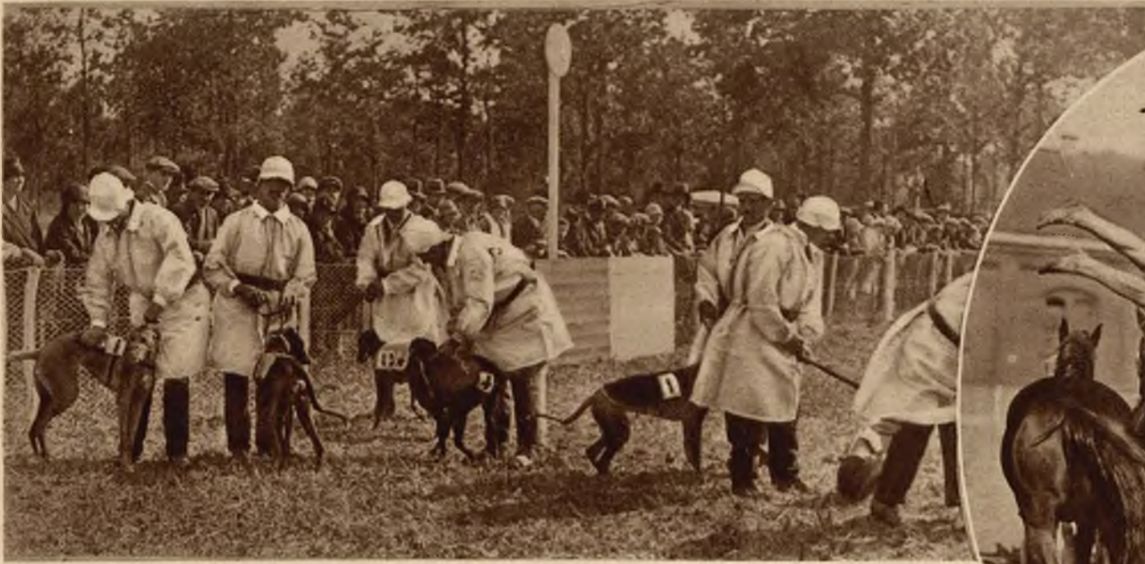
Zdjęcie z modnych obecnie wyścigów „psich“ w Chantilly pod Paryżem.