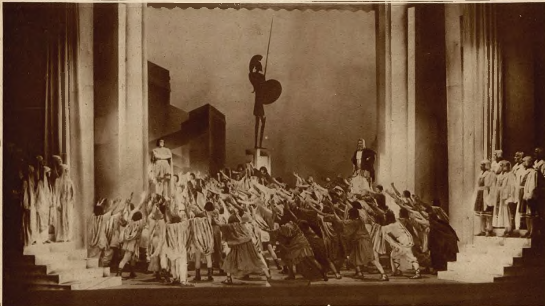
Dramat Słowackiego „Król Agis”, wystawiony został obecnie po raz pierwszy przez Teatr Narodowy w Warszawie. Zdjęcie nasze przedstawia scenę na rynku w Sparcie podczas sporu o istotę reformy rolnej.