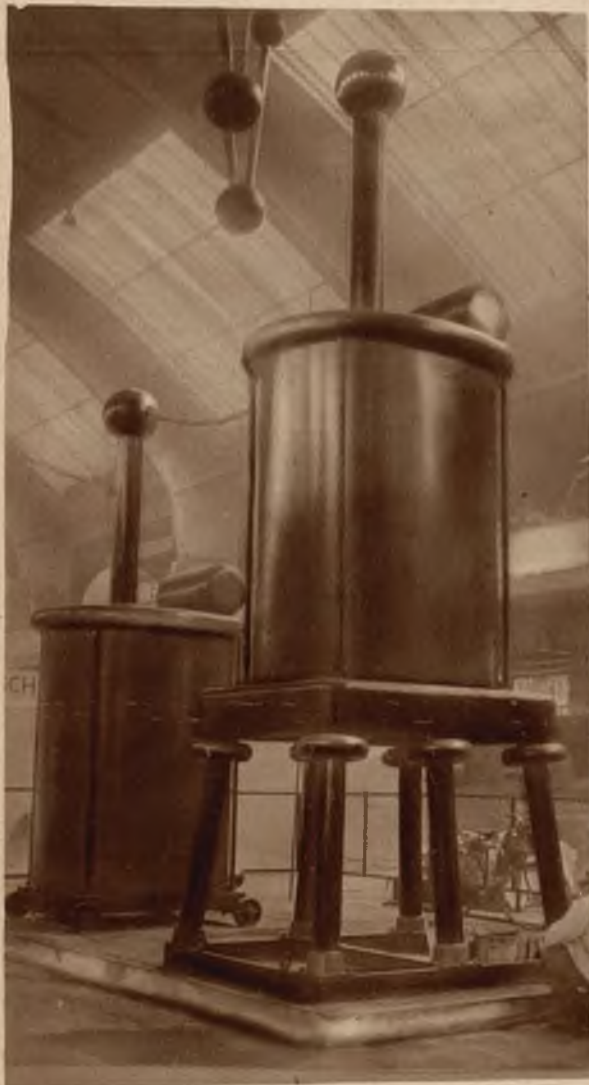
Olbrzymie transformatory do wytwarzania prądu elektrycznego o sile 1 miliona wolt.

Na prawo: Premier angielski, który znany jest z tego że nie rozstaje się nigdy z fajką, odwiedził obecnie uniwersytet w Birmingham. Studenci na przyjęciu ofiarowali mu fajkę metrowej wielkości, a sami wszyscy wystąpili z fajkami w ustach.