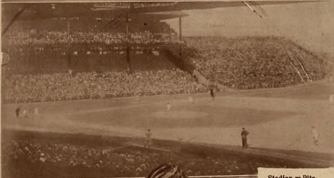
Stadion w Pittsburgu (St. Zj.) obejmujący 80.000 tysięcy widzów