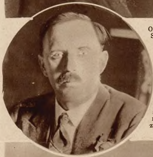
Obrazy z procesu Schwarzbarda w Paryżu. U góry na lewo: Wdowa po Petlurze i jego brat. Na prawo: Schwarzbard na ławie oskarżonych. Pod nim słynny adwokat Torres.

Na lewo: Znany przywódca górników angielskich Cook, który miał przyjechać na zjazd górniczy do Warszawy.