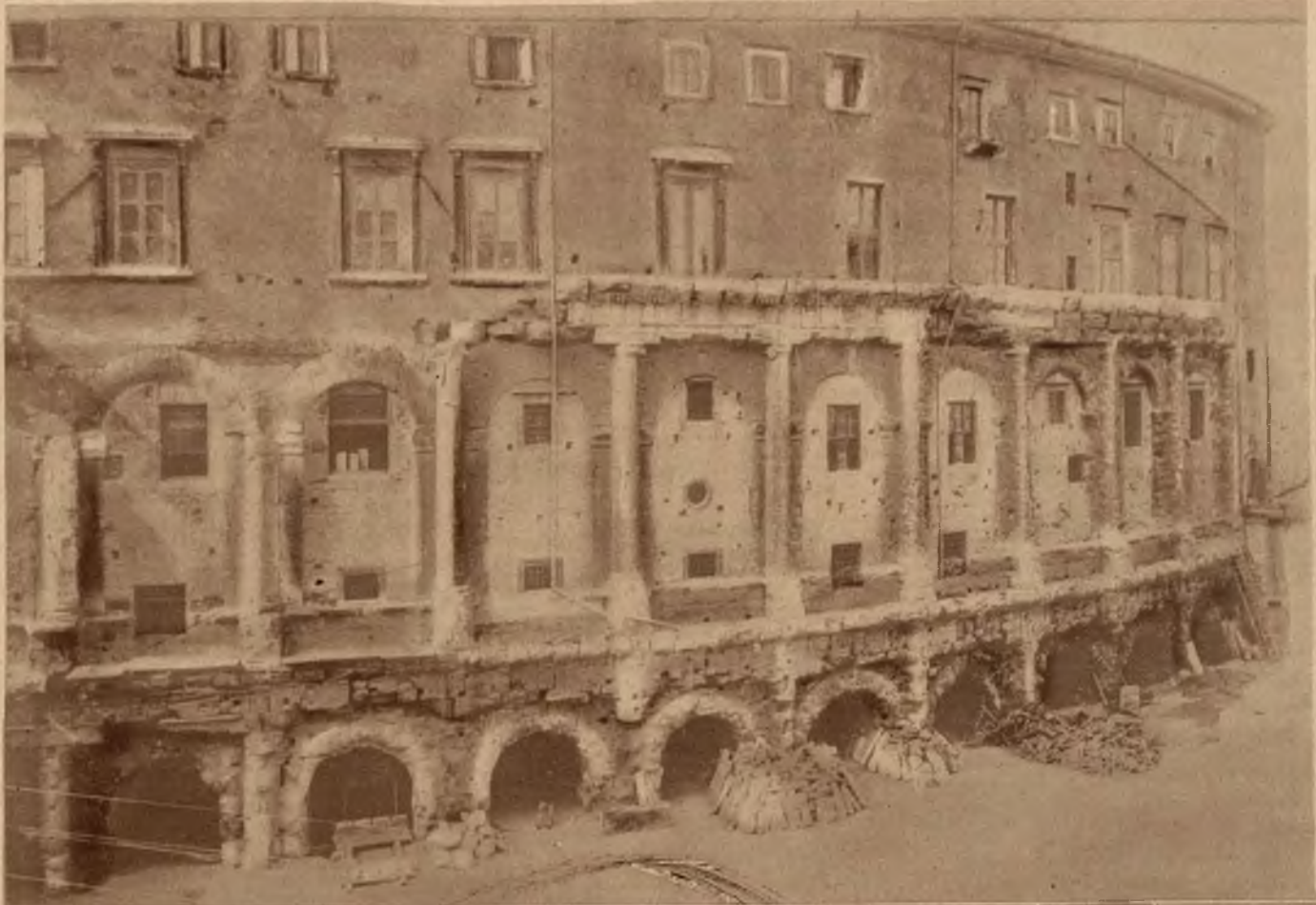
Na lewo: W Rzymie odbywają się obecnie na rozkaz Mussoliniego prace nad oczyszczeniem teatru Marcellusa, pochodzącego z 1 w. po Chr. Na teatrze znajduje się budowla dorobiona w XIV w.