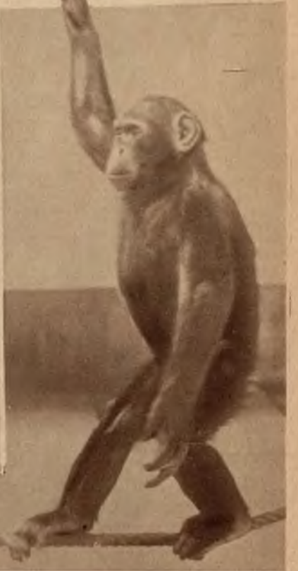
U dołu: Zdjęcia z zwierzynicy londyńskiego: Małpa jako linoskoczek. U dołu: Rodzina pelikanów przy toalecie.