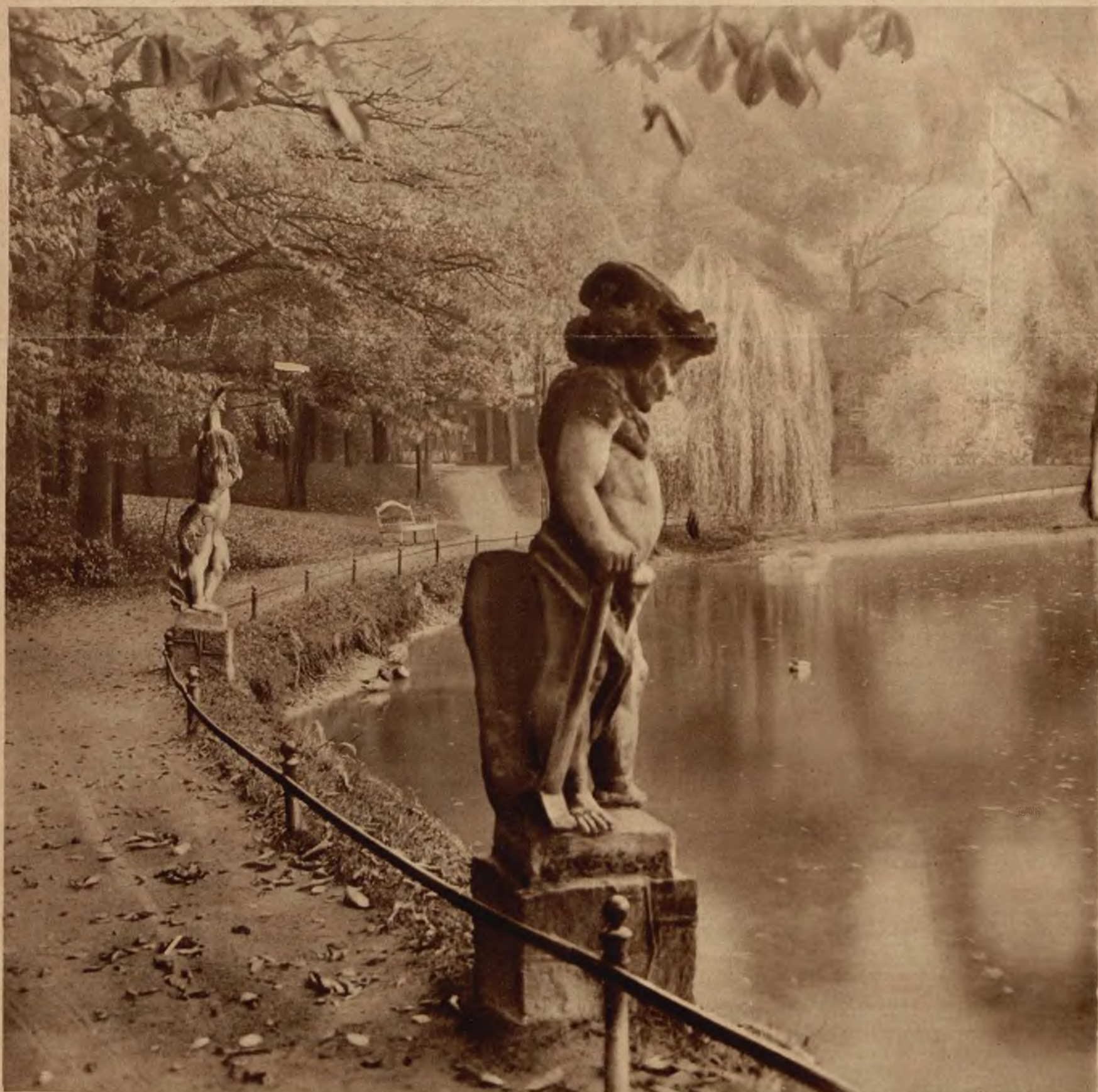
Leci liście z drzewa... Nastrojowy obrazek jesienny z jednego z parków londyńskich.