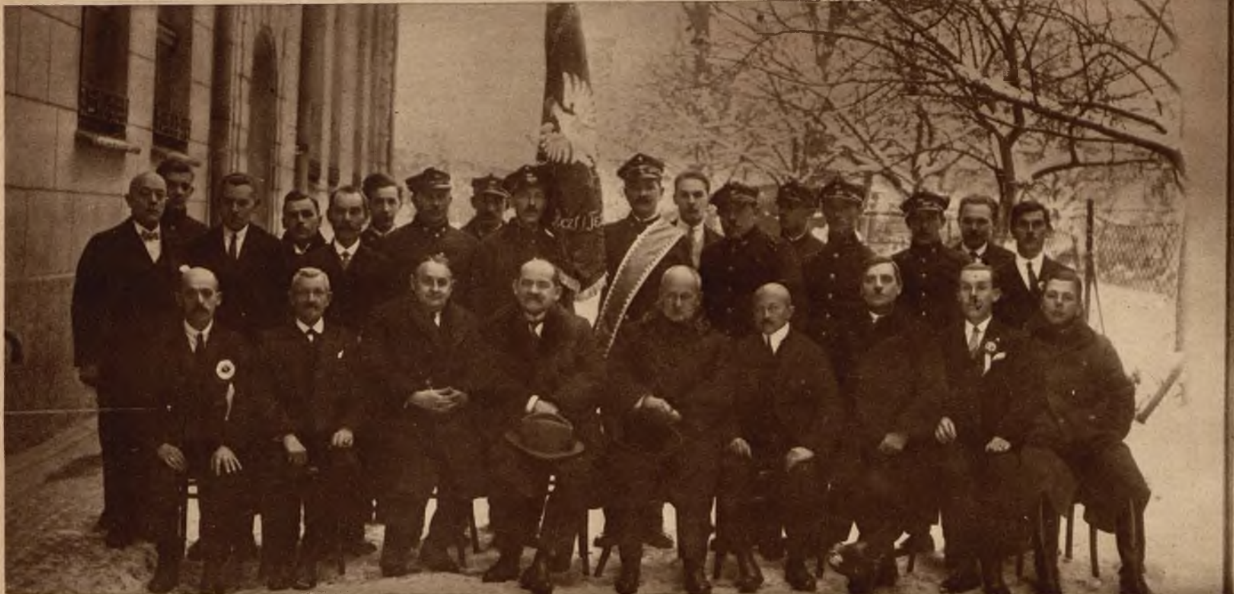
U dołu: Komitet związku poświęcenia sztandaru niższych funkcjonariuszy pocztowych we Lwowie.