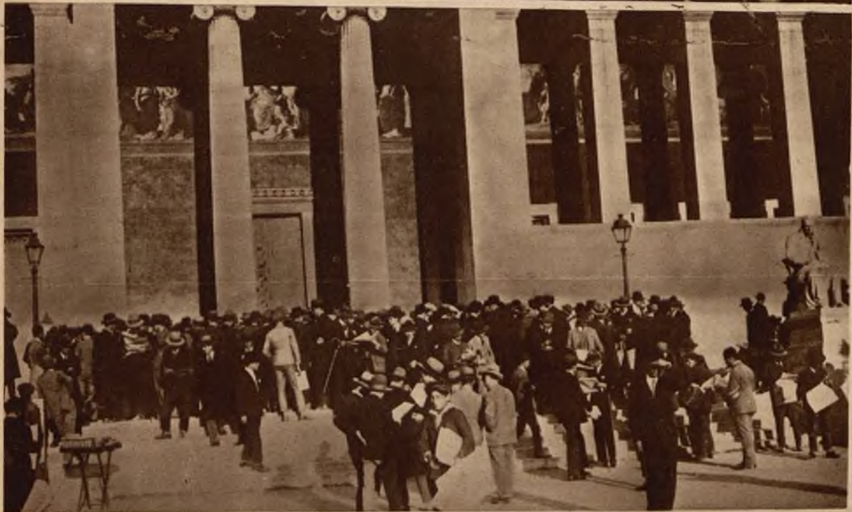
Na lewo: Gmach uniwersytetu ateńskiego, podczas ostatniego strejku uczniów, wywołanego względami ekonomicznymi.