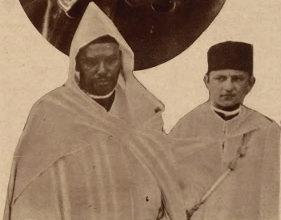
Po zmarłym sultanie Marokka Mulai Yussufie, objął władzę 18-letni syn jego Mulai Amada. Widzimy go tu wraz z ochmistrem dworu.