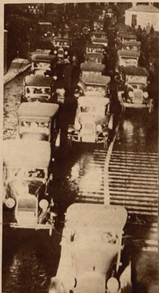
W dzień otwarcia tunelu Hollanda, łączącego N. Jork i N. Jersey, przejechało przezeń 50.000 samochodów.