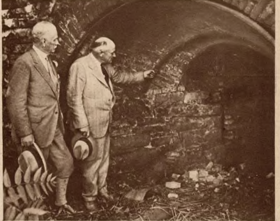
Rusznikarnia starego i nowego typu. 1. Na lewo ogromna odlewnia stali w Anglii (Middlesbrough), gdzie obrabia się materiał dla uzbrojenia najpotężniejszej floty świata. 2. Na prawo kocioł w Maryland (St. Zj.), w którym podczas wojny o niepodległość przetapiano żelazo na granaty i kartacze.