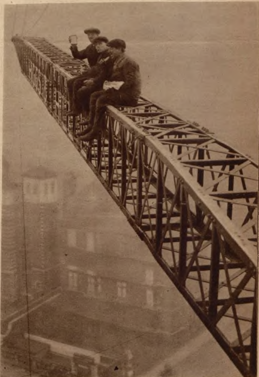
Budowa największego na świecie żurawia na stacji kolejowej Baker Street w Londynie.