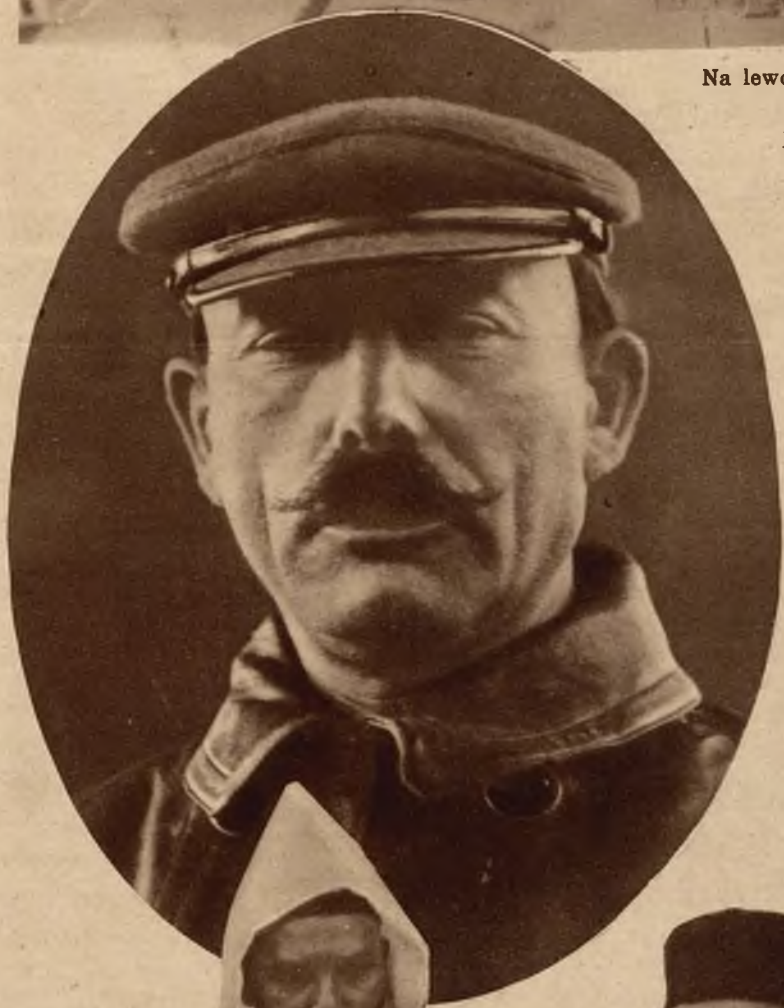
Na lewo w owalu: Słynny agitator sowiecki Borodin, motor poczynañ chińskiej armji rewolucyjnej, wypłynął znów na widowię polityczną.