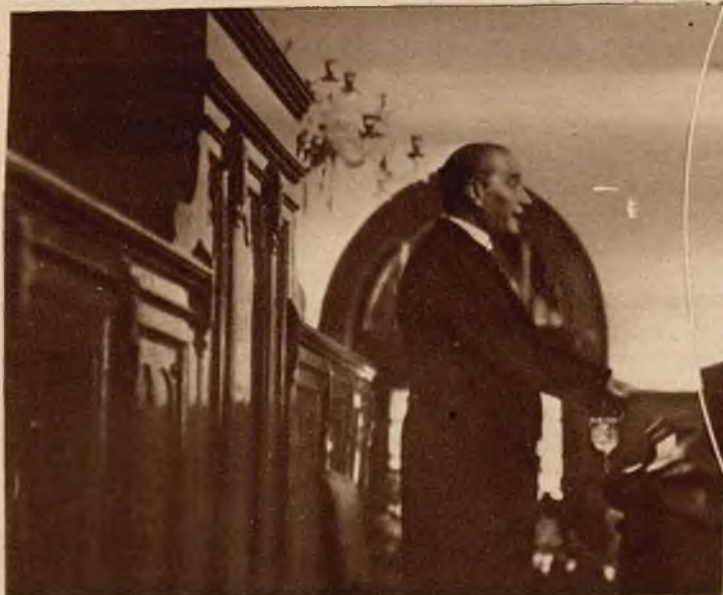
Dyktator Turcji Mustafa Kemal Pasza zaprzysiął nową konstytucję. Nie uznając władzy wyższej od siebie złożył przysięgę sam sobie.