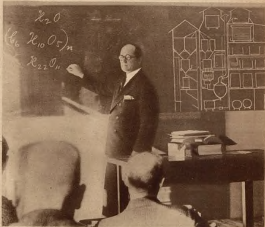
Agitację antialkoholową w Ameryce szerzą gruntownie teoretycznie i praktycznie wyszkoleni agenci. Na rycinie — wykład o browarnictwie na kursie teoretycznym.