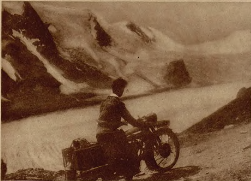
Wiedeński inżynier Rübelt dotarł w Alpach motocyklem do wysokości 2418 m.