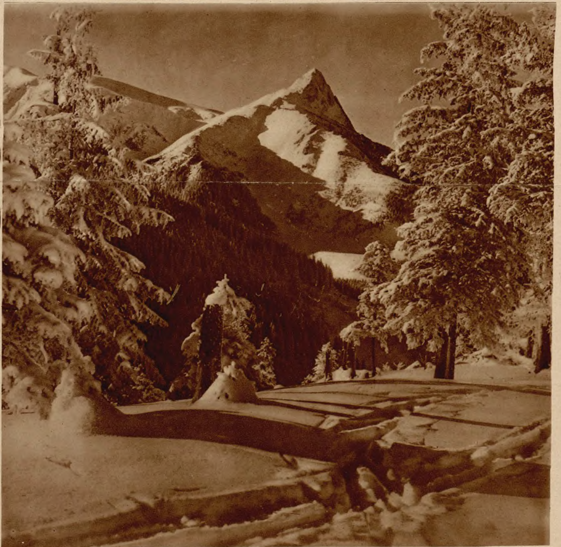
Giewont w szacie zimowej.