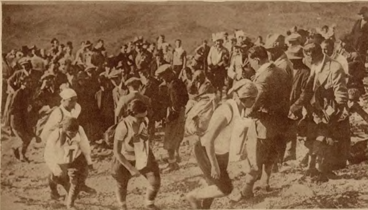
Grupa zawodniczek „biegaczek“ we Włoszech podczas wyścigów na górzystym szlaku walczy pzzeciwnko męskim uczestnikom zawodów.