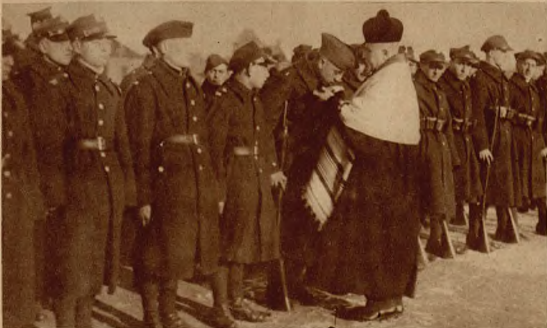
Zaprzysiężenie rekrutów wyznań niekatolickich. Moment odbierania przysięgi. U góry: kapłan prawosławny. U dołu: Rabin żydowski.