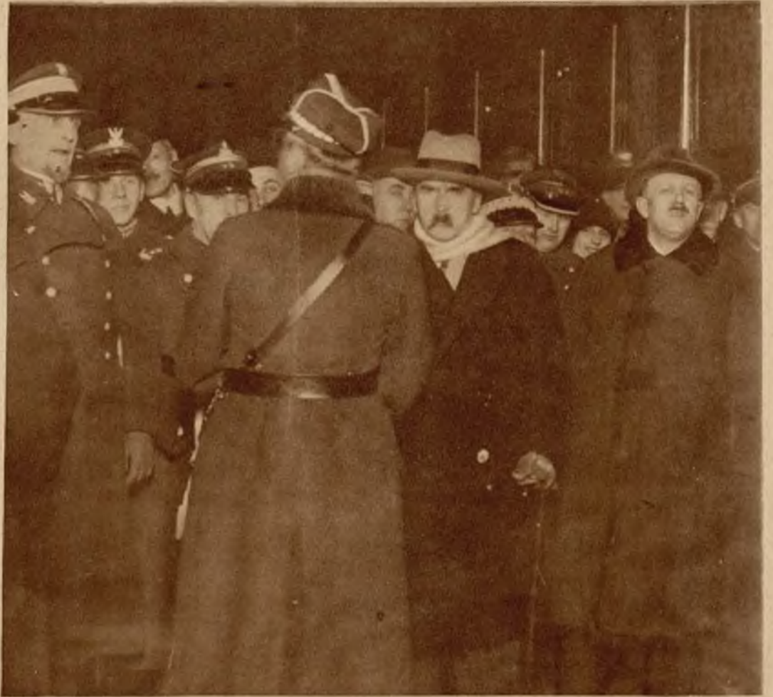
Z podróży Marszałka Piłsudskiego do Genewy. Na lewo: Marszałek i pułk. Beck, szef kancelarii wojskowej. U góry: Marszałek na Dworcu Warszawskim. Obok stoi wicepremier Bartel.