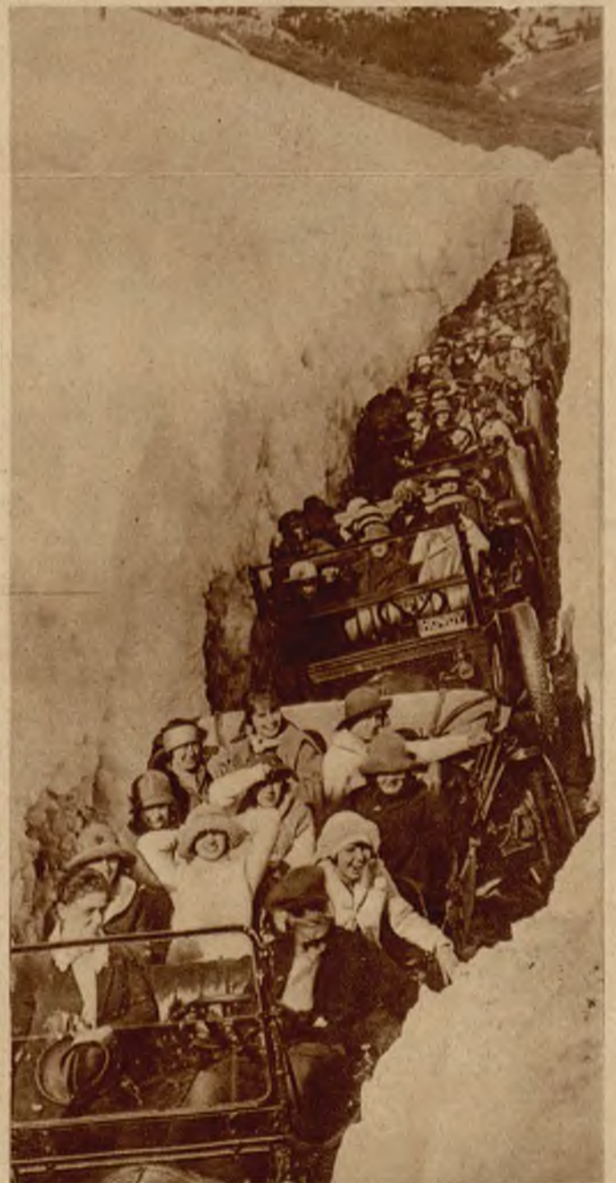
Droga w Górach Skalistych zasypana przez lawinę, w której wykopano tunel, mieszczący z trudnością samochód.