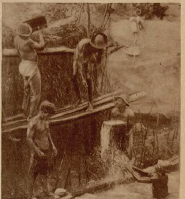
W Brazylii odkryto rozległe pokłady czarnych diamentów. Widzimy tu w jak prymitywny sposób odbywa się eksploatacja bezcennych pokładów.