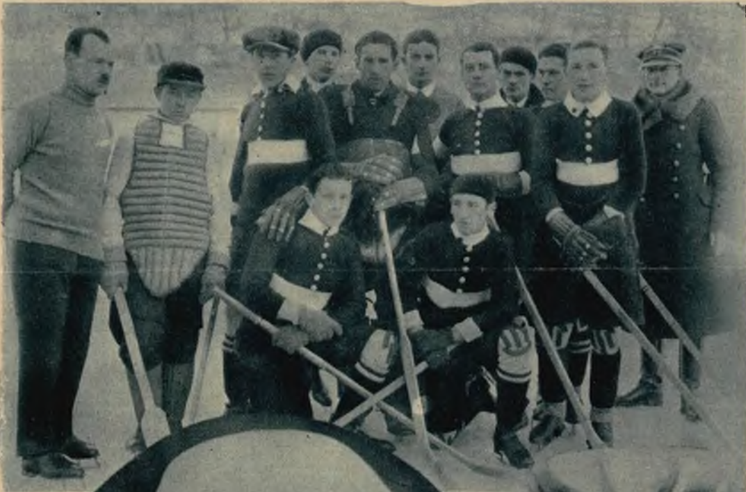
Na lewo: Drużyna hokeyowa Lwowskiego Tow. Łyżwiarskiego.