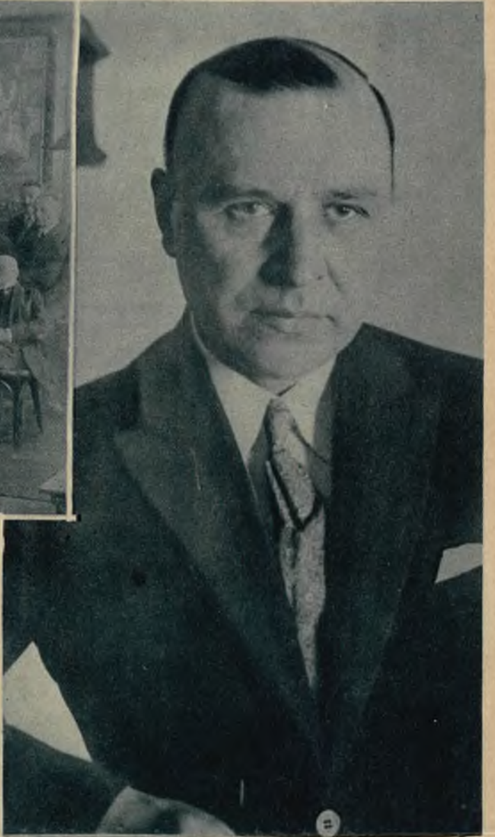
Wiceminister sprawiedliwości Stanisław Car mianowany został przewodniczącym Głównej Komisji Wyborczej.