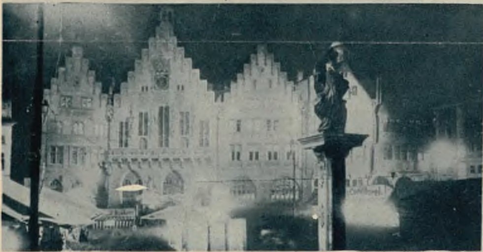
Dwa nocne zdjęcia z ruchu przedświątecznego. U góry plac Aleksandra w Berlinie. U dołu rynek w Frankfurcie.