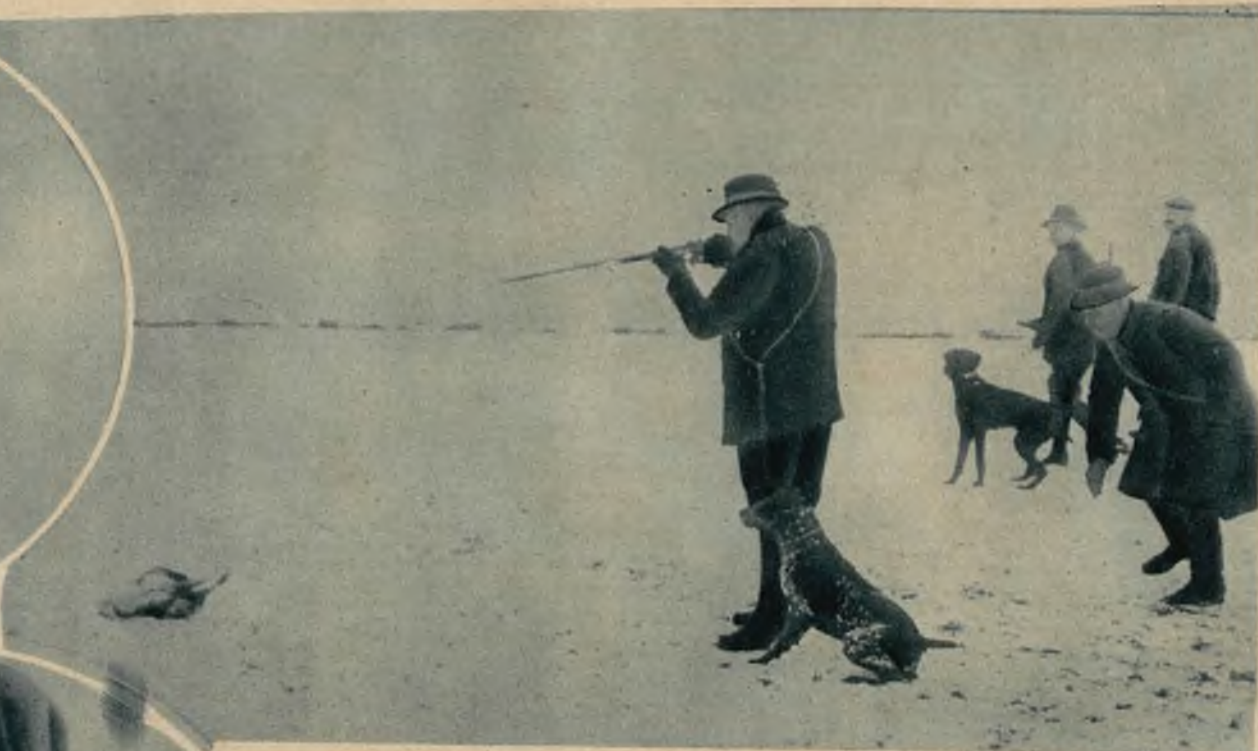
Z pierwszym śniegiem nastął zły czas dla zający. Ciągłe polowania z nagonką przere- dzają szeregi biednych szaraków. W górnym kole widzimy udatne zdjęcie zająca w gwał- townej ncieczce. U góry celny strzał i rolujący zając. W dolnym kole aport łupu.