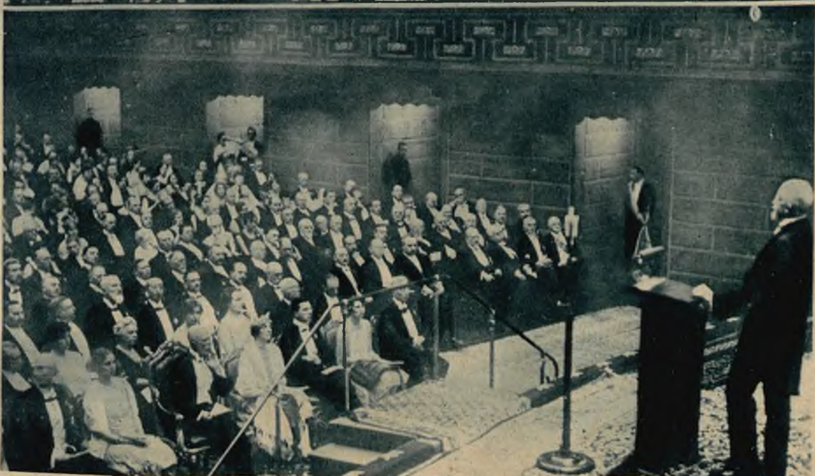
Na prawo: Zdjęcie z tegorocznego rozdania na- gród Nobla w Sztokholmie. W pierwszym rzędzie rodzina królewska, obok wszyscy laureaci.