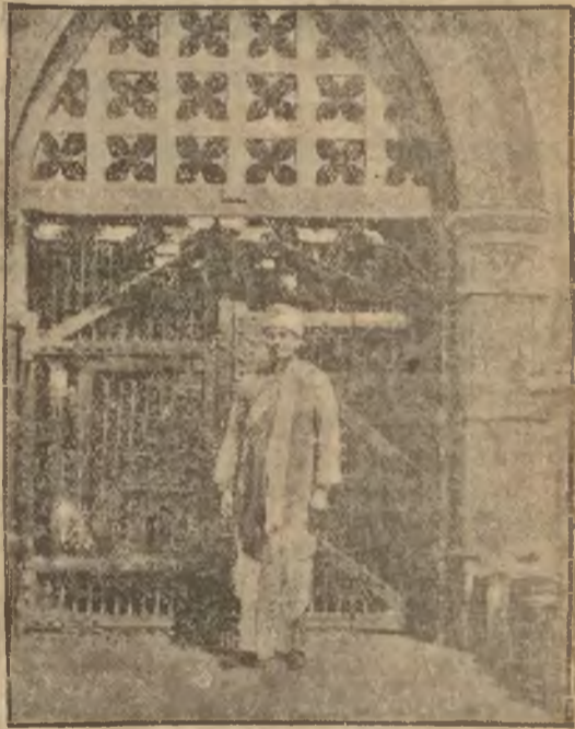
w którym osadzono Gandhiego i Patel, przewodniczącego wszechindyjskiego kongresu.

Przy zmianie adresu prosimy PT. Prenumeratorów o łaskawe podanie dawnego adresu.