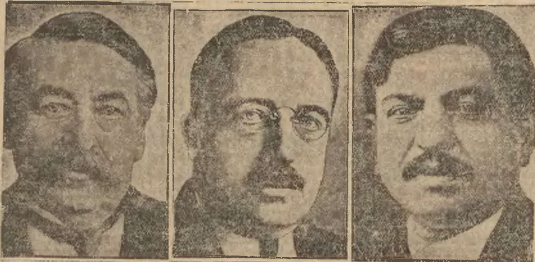
Rząd francuski został zrekonstruowany. Ministerstwo spraw zagranicznych objął po Briandzie premier Laval, a sprawy wojskowe po Maginocie — Tardieu.