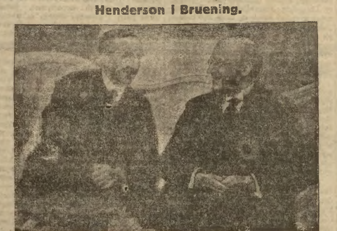
Delegaci Angliji i Niemiec na konferencję rozbrojeniową w Genewie prowadzą przyjacielską pogawędkę. Sądzą z wyrazu twarzy obu ministrów, pogawędka ta nie dotyczy zapewne niemieckiego projektu rozbrojenia.